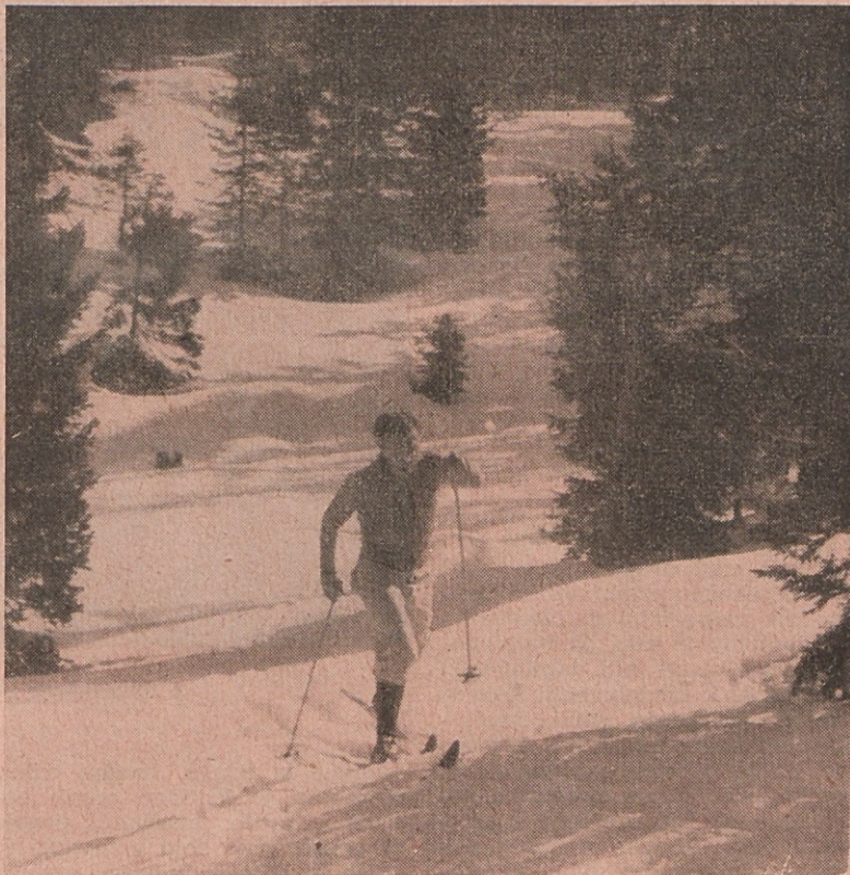
Rekreacija na smučeh