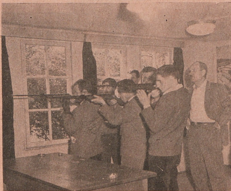
Naši nekdanji strelci

Le ob izgradnji teh prepotrebni objektov bomo lahko pričakovali razvoj rekreacije v Litostroju in le tako bomo lahko nudili Litostrojčanom, kar zaslužijo in jim pripada v prostem času.