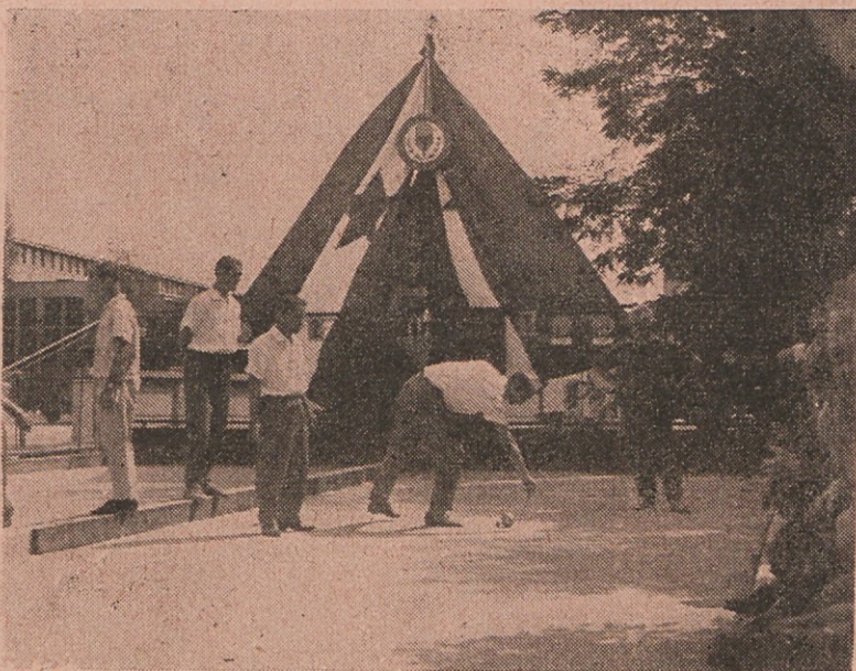
Zaradi kanala, ki teče skozi Litostroj, so porušili komaj zgrajeno balinišče