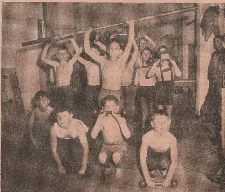
Z dviganjem uteži se krepijo prsi

Izvršni odbor glavnega odbora sindikata tovarne je na svoji zadnji seji med drugim razpravljala tudi o poročilu predstavnika Centra za rekreacijo v Litostroju. Ugotovljeno je bilo, da ne moremo organizirati niti vsakoletnih priljubljenih medobratnih tekmovanj v balinanju, šahu, streljanju, namiznem tenisu itd., še manj pa, da bi govorili o organiziranih oblikah in izvajanju programa rekreacije za Litostrojčane v prostem času. Vzrok: nimamo nobenega igrišča, balinišča, prostora za sobne športne igre, telo-