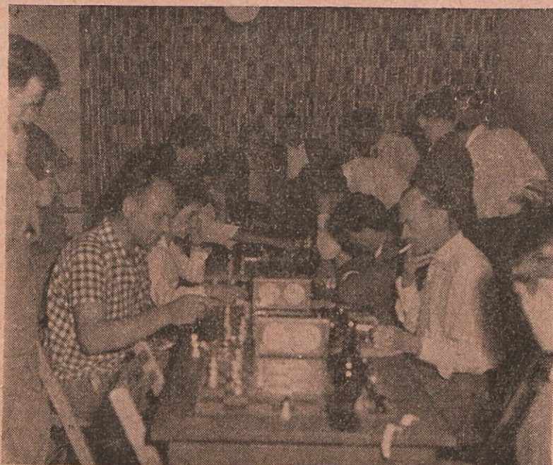
Ko so imeli šahisti še svojo sobo...