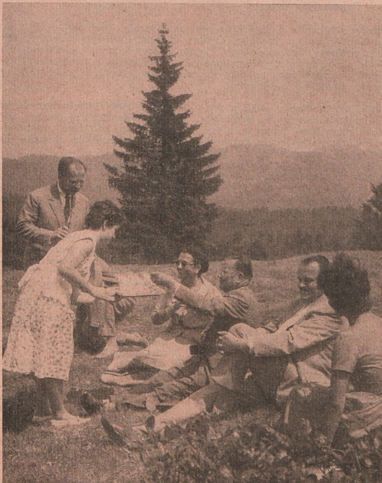
Visoki gostje na Sorški planini

Mnoga industrijska središča in velika mesta so že začela graditi objekte in naprave za aktivni, vsakodnevni in tedenski počitek. V neposredni bližini so zgradili