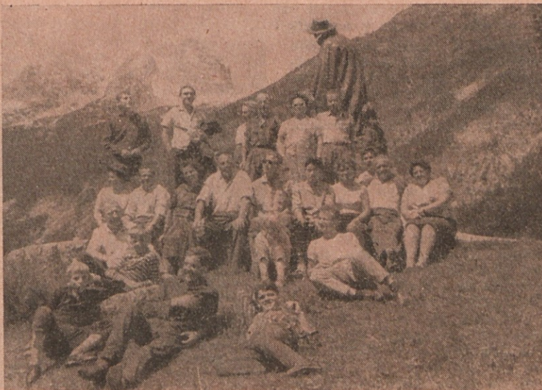
Planinci pred Kugijevim spomenikom v Trenti