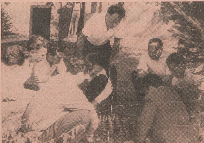
... Zdaj igrajo dobesedno na cesti

Troboj kot ena izmed oblik športne rekreacije kolektivov Metalne, STT in Litostroja, bo ostal tudi v bodoče, toda v nekoliko spremenjeni obliki. Tekmovanje v dosedanjih panogah, t. j. nogometu, odbojki, kegljanju, balinanju, šahu, namiznem tenisu in streljanju, bo v bodoče organizirano v treh skupinah. Prva bo v letu 1964 v organizaciji našega podjetja tekmovala v Ljubljani, in sicer v namiznem tenisu, streljanju in šahu. Tekmovanje bo zaključeno predvidoma pred 1. majem. Druga bo v nogometu in odbojki tekmovala v Trbovljah. Tretja skupina tekmovalnih disciplin v kegljanju in balinanju pa bo zaključila troboj v Mariboru. Vsa ta tekmovanja bodo izvedena in tehnično organizirana tako, da bo tekmovanje ene skupine zaključeno v enem dnevu. Točkovni sistem bo ostal isti kot doslej in na zaključnem tekmovanju v Mariboru se bo zbralo skupno število točk. Tu bodo tudi