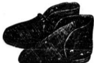
Otroške D 25'— za odrasle " 39'—