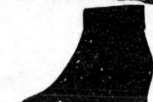
Tretorn damske sneške D 98'— najfinije D 128'—