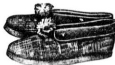
od št. 36 - 42 samo D 26'— boljše " 29'— Najfin. damske ali moške " 39'—