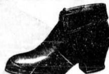
Damske sneške D 39'— boljše vrste " 68'— Damski skorajji Tretorn " 59'—