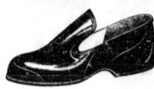
Moške galose D 39'— švedske " 58'— Tretorn " 68'—