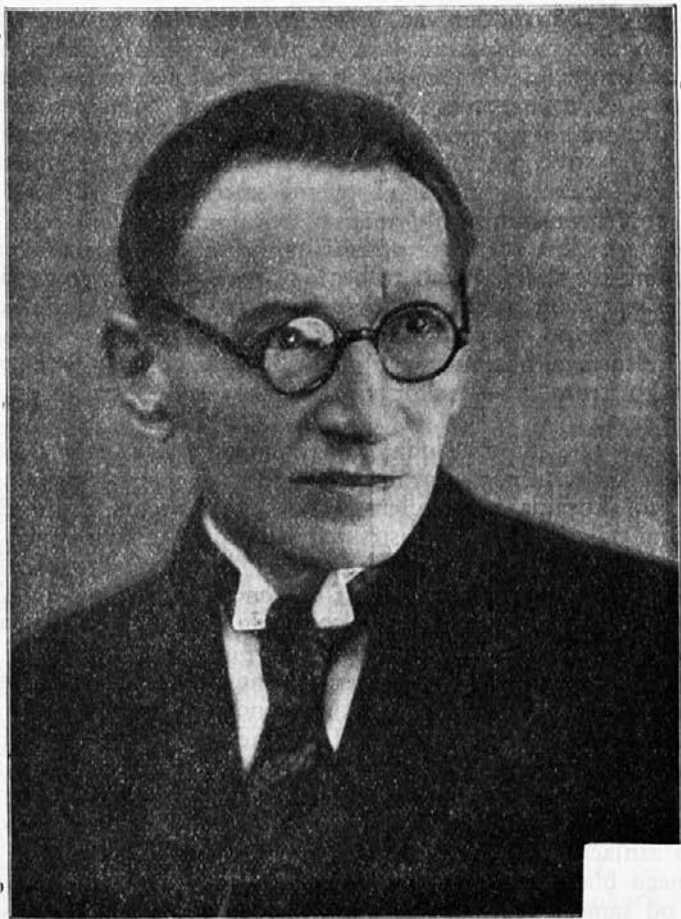
Oton Župančič, upravnik Narodnega gledališča v Ljubljani.