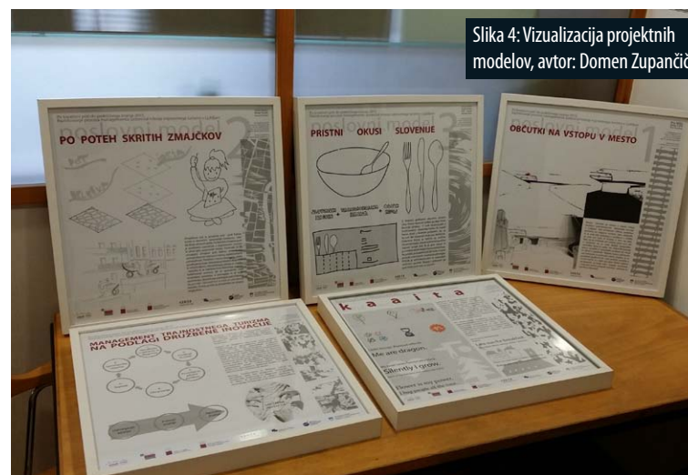
Slika 4: Vizualizacija projektnih modelov, avtor: Domen Zupančič.