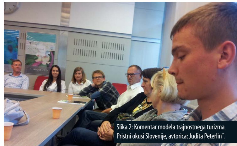
Slika 2: Komentar modela trajnostnega turizma Pristni okusi Slovenije, avtorica: Judita Peterlin.