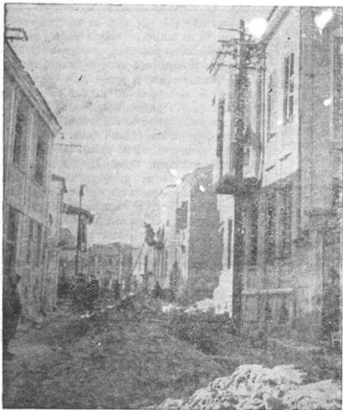
Pogled v bitoljsko ulico, ki so jo zadale bombe ob prvem letalskem napadu neznanih tujih letal na naše lepo mesto Bitolj

Po močnih napadih, ki so jih izvršile grške čete na svojem levem krilu, so se Italijani umaknili na svoje prvotne postojanke, kjer so se utrdili, dokler jim ne pride na pomoč rezerva. Grški protinapadi so bili posebno močni v okolici Korice. Italijanska poročila objavljajo, da so bili vsi grški napadi odbiti. Grki pa poročajo da se je njihovo prodiranje nadaljuje in da so dosegli že na več krajih albansko mejo.