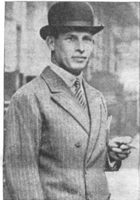
GRŠKI KRALJ JURIJ