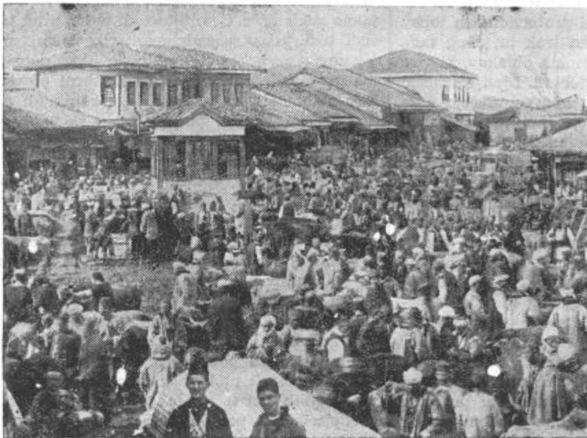
Nad Bitoljem so se ponovno pojavila tuja letala. Prvič je bilo mesto bombardirano prav za časa dobro obiskanega sejma, ki ga kaže naša slika

Kljub prizadevanju marljivih gasilcev je ogenj upepelil vsem štirim posestnikom njihove domačije in napravil nad 300.000 din škode.