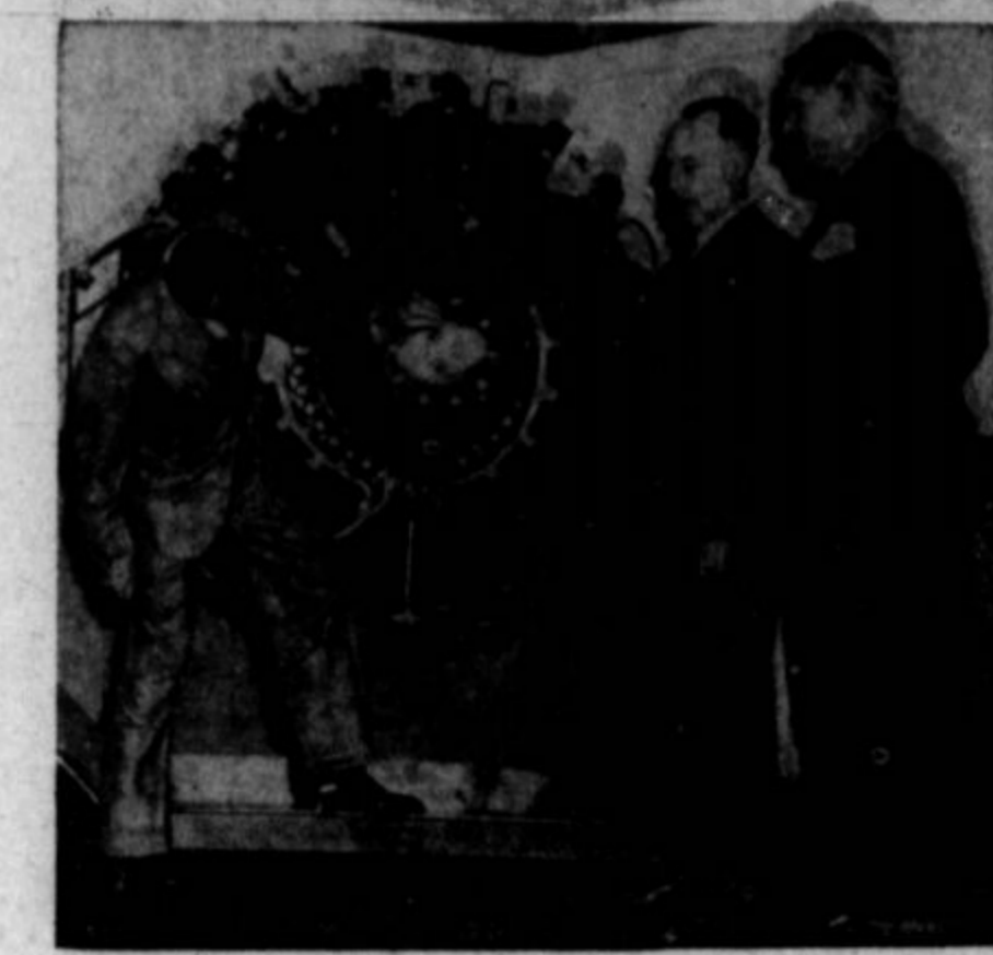
V pričetku sedanjega ameriškega oboroževanja na debelo je Henry Ford dejal, da ne bo prevzel vojnih naročil ameriške vlade, ako bi dobila del njegovih strojev Anglija, kajti nji on ne bo pomagal. Pa so mu namignili, da se v kongresu pripravljajo zakon (ki je bil tudi sprejet) za konfisciranje tistih tovarov, katerih lastniki pri pripravljanju na obrambo ne bi hoteli sodelovati. Nato se je Henry Ford podal in že gradi tovarno za izdelovanje aeroplanskih motorjev, da zadosti naročila zvezne vlade. Od tega bo imel on dobiček, a v politiki je svojo jezo nad Rooseveltom izrazil s indorsiranjem republikanske kandidata Willkieja, katerega je v ta namen osebno obiskal, da je bilo več publicitete. Na gornji sliki je Ford in z njim dva druga industrialca, ki študirajo motor, kakršne nameravajo izdelovati na debelo.