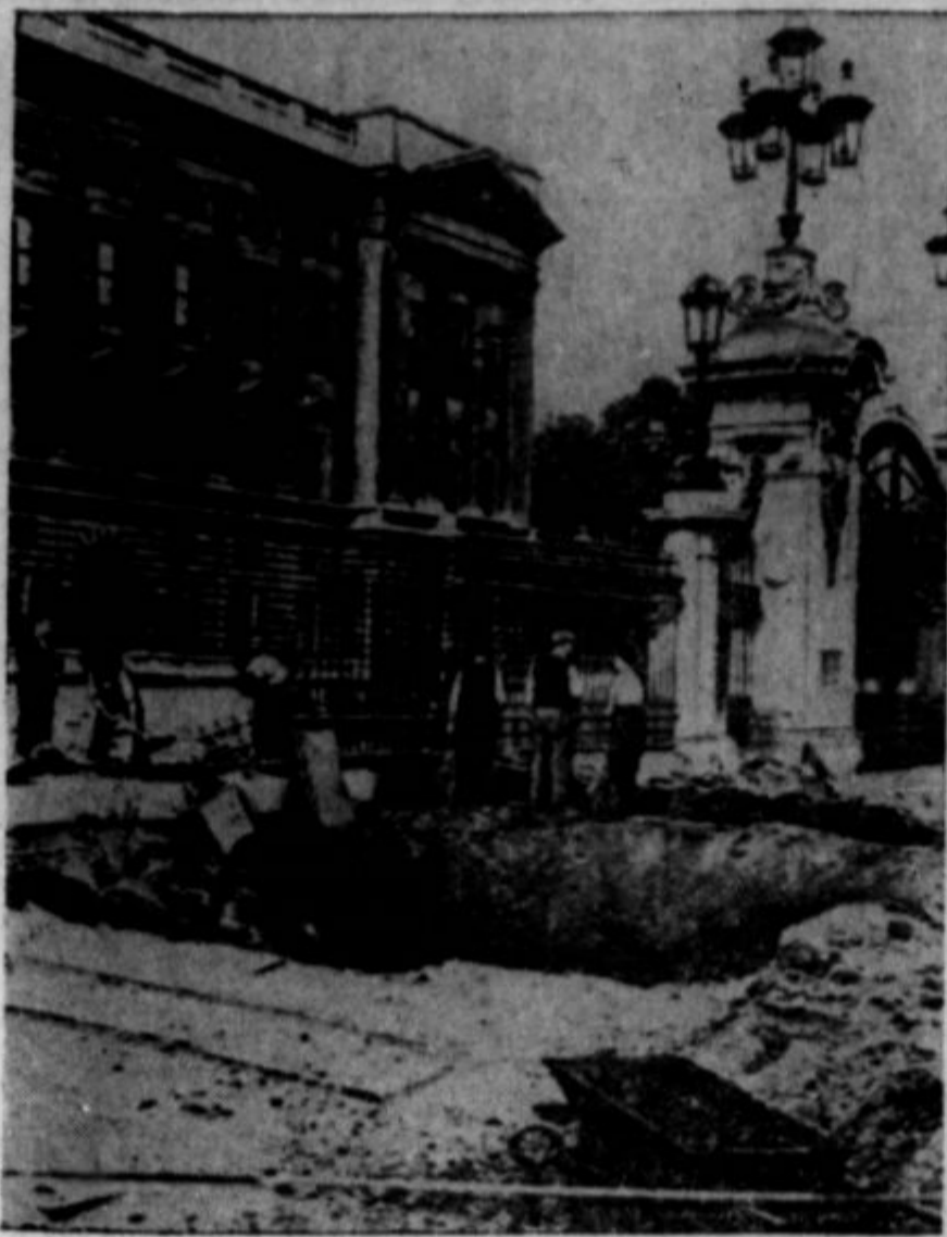
Nemikim letalcem se je že večkrat posrečilo zadeti tudi dvor Buckinghamski v Londonu, ki je dom angleškega kralja. Ena je padla tik palače. Ta je razpočila pozneje in izdolbila v tla veliko jamo. Te vrste bombe povzročajo Londončanom težke skrbi. Narejene so tako kakor takozvani peklenjski stroj. Razpoči sele kadar poteče "njen čas". Tu in tam delavci kakšno odstranijo, toda to je smrtonosen posel, ker ničče ne ve, kateri moment bo eksploziviral.

tudi imenujejo Grško ali Bizantinsko cesarstvo. Belgrad je prišel pod Bizantinice. Imenovali so ga Singidon.