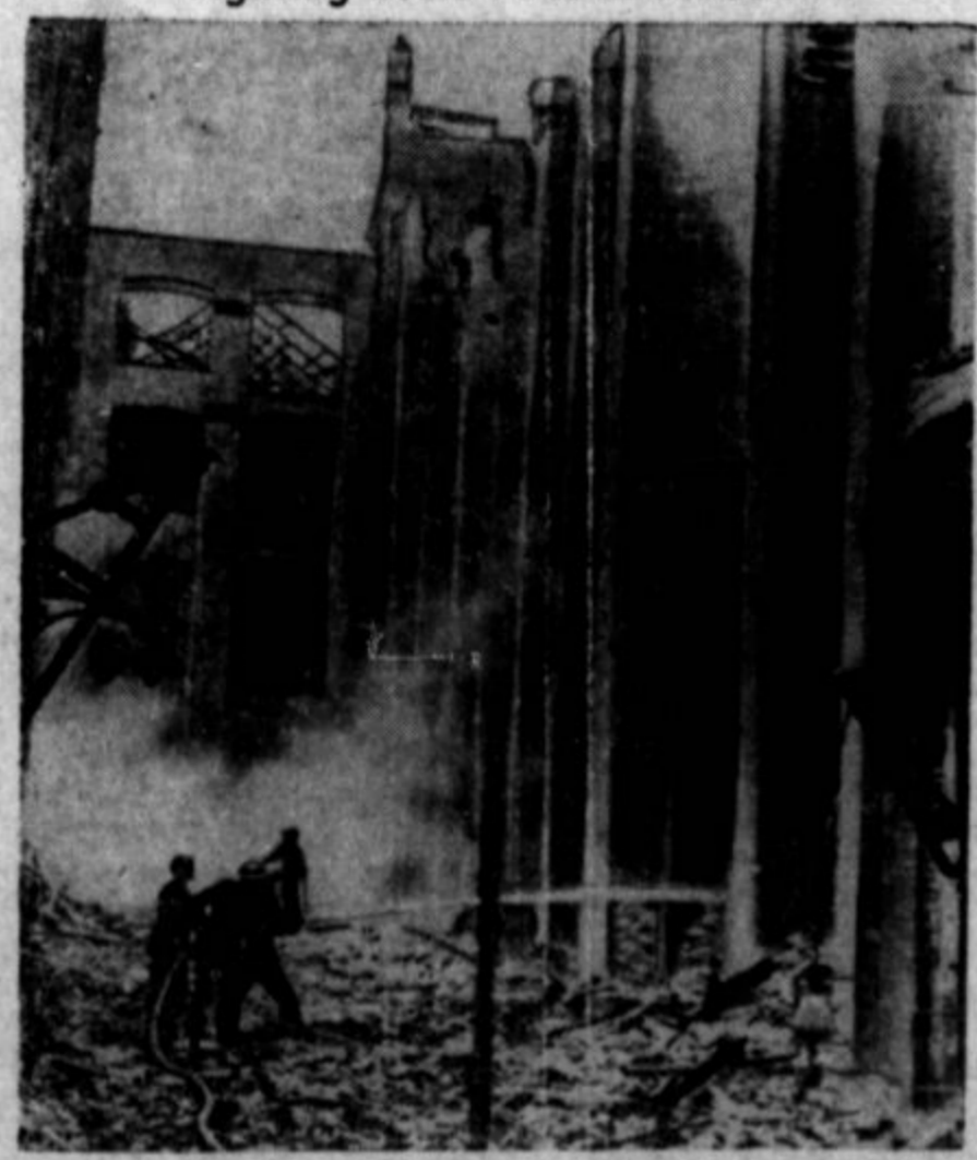
Firemen are shown working amid the debris of one of the many buildings bombed and set afire by Nazi airmen in one of their raids on London. German air raids have been continuous during the past few weeks, keeping Londoners in air raid shelters much of the day and night.