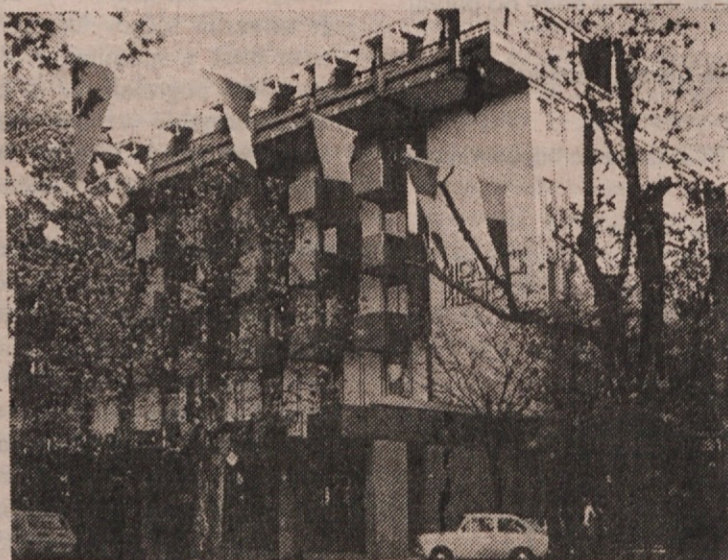
PH-PALACE HOTEL, Corso Italia 63

34 170 Gorizia-Gorica, Italy; Tel.: 0481-82166; Telex 461154 PAL GO I