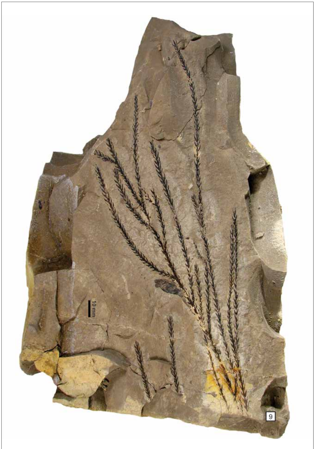
TABLA 2 - PLATE 2