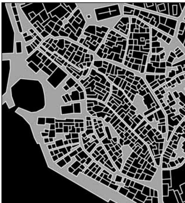
Sl. 1: Javni prostori, vrinjeni med zasebnimi hišami v starem mestnem jedru Izole (Gužič-Trplan in Cankar – European 7).

Pri tem pa ne moremo zanemariti povezovanja ljudi na podlagi informacijsko komunikacijske tehnologije, ki je "neobčutljivo za oddaljenost" (distance insensitive).