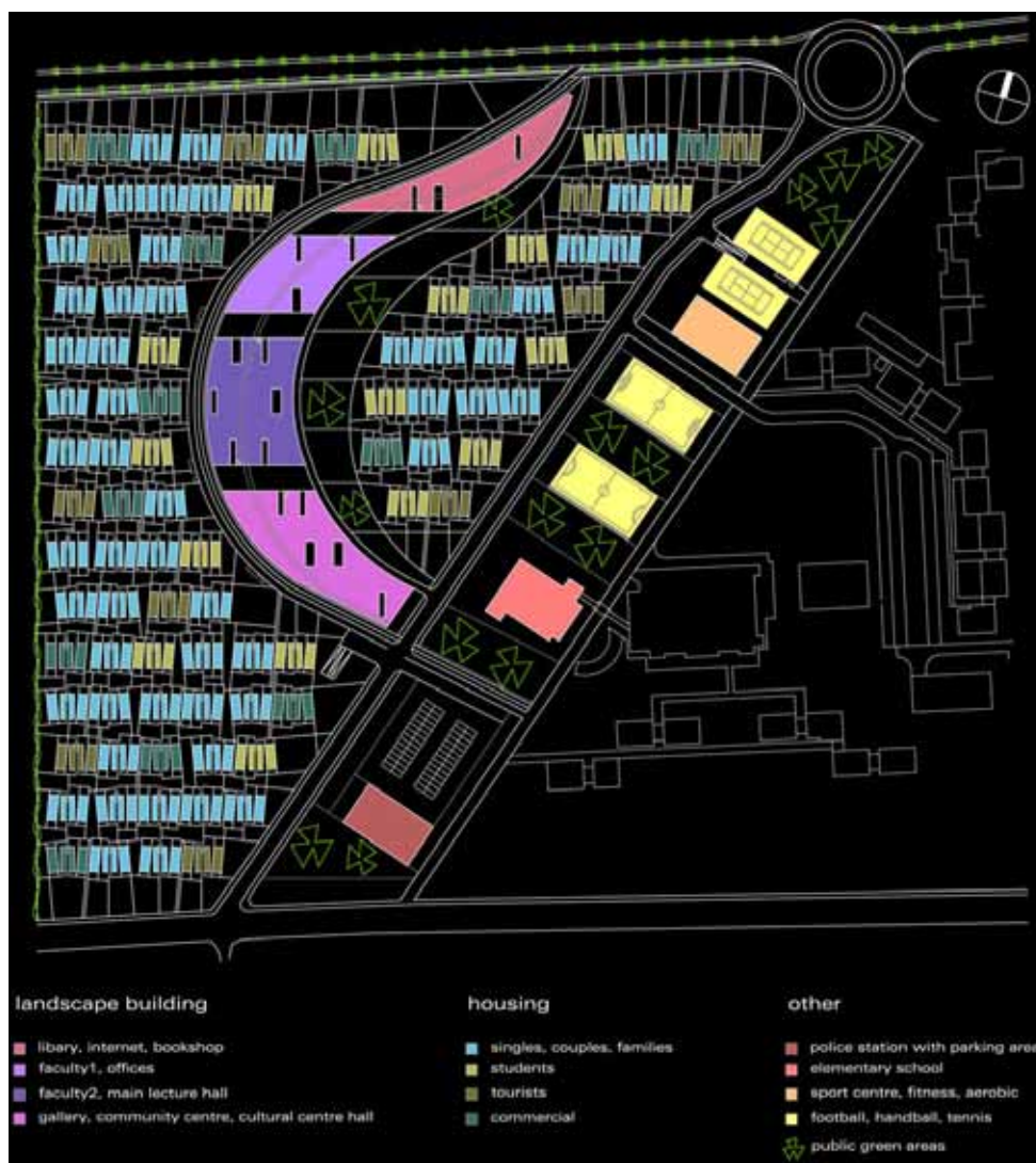
Sl. 2: Urbana intenziteta – glavni koncept (Gužič-Trplan in Cankar – Europan 7).