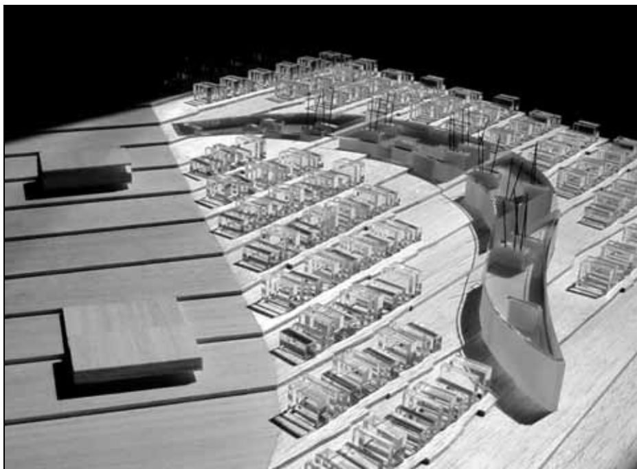
Sl. 3: Pogled na maketo naselja: Fleksibilnost-urbana koherentnost-krajinska kvaliteta (Gužič-Trplan in Cankar – Europan 7).

Avtor se zavzema za to, da bi poleg določenega zaprtega življenjskega prostora vsaka enota razpolagala z vsaj malo zunanjega prostora kot možnim podaljšanjem notranjosti. Pri tem – sporno – utemeljuje, da poljavni prostor omogoča podobne družbene aktivnosti, kot so značilne za tradicionalno življenje!? Ali torej že prostori sami (lahko) ohranjajo tradicionalni način življenja? Novi (zunanji) življenjski prostori da spodbujajo nadaljnje razvijanje družbenih interakcij. "Posamezne enote različnih velikosti z zaprtimi in zunanjimi prostori so povezane v longitudinalne grozde (clusters), ki se dvigajo nekaj nadstropij visoko in so povezane s pomočjo širših poti na jugu le-teh, in delujejo kot privzdignjene ulice, kot tudi senca za stanovanja na nižji višini. Vzdolž ulice se vsake toliko časa pojavijo presledki v