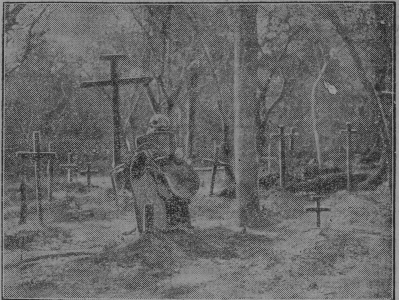
Vojaško pokopališče Paragancev v Gran Chaco v Južni Ameriki, kjer divja vojna med državama Bolivija in Paragvaj. — Levo: Angleški princ Jurij se je poročil z grško princeso Marino.