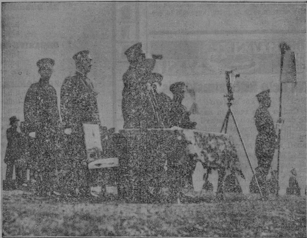
Cesar nove mandžurske države opazuje z dalnogledom vaje svojih čet.

daj za počitek. Zbrali smo se krog ognja in Campbell, ki je prepotoval malodane celi svet, nam je postregel z mičnimi pripovedkami o samotarskih Robinzonih, katerih je celo v današnjih časih več v daljši soseščini s Cocos otočjem. Iznad Velikega Oceana se namreč dviga vse polno manjših otokov, ki so kakor nalašč za samotarsko življenje po razbitju ladje ali tudi iz prostovoljnih nagibov. Povesti o Robinzonih, dasi stare, so vedno nove ter dražijo človeško radovednost.