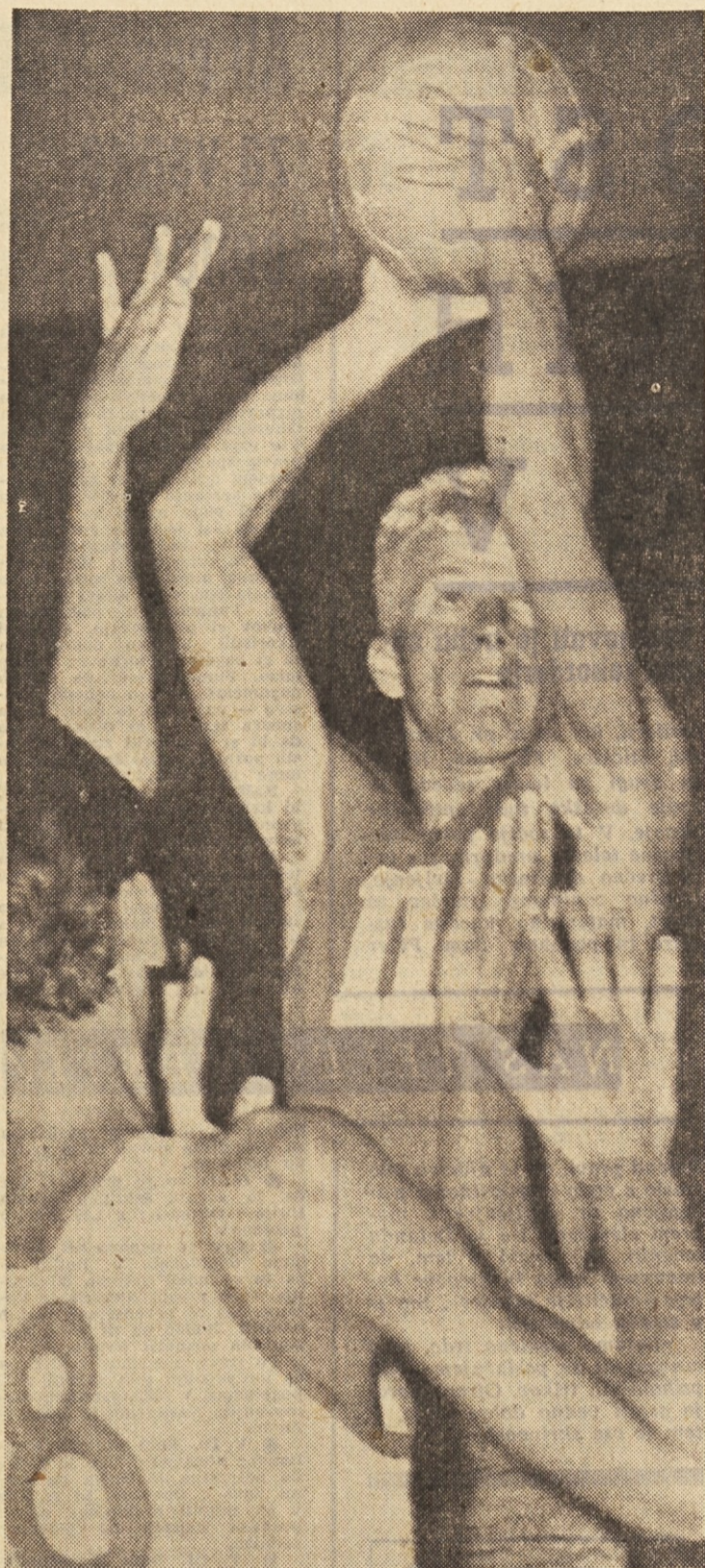
Ce kdo vpraša, od kod uspehi Olimpije, mu lahko odgovorimo: strokovnost, borbenost in volja do zmage