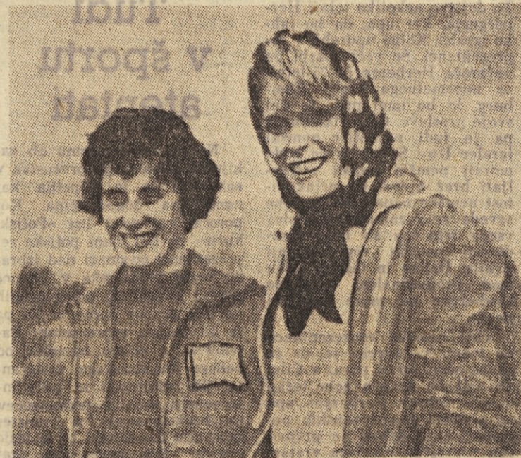
Dve najhitrejši dekleti Evrope — Angležinja Dorothy Hyman in Nemka Jutta Heine

Omenjene pomanjkljivosti bi lahko izostale. Potem bi bila končna ocena še toliko boljša, sicer pa, roko na srce, organizacija je opravila svoj veliki izpiz z več kot dobro oceno, boljše kot smo pričakovali!