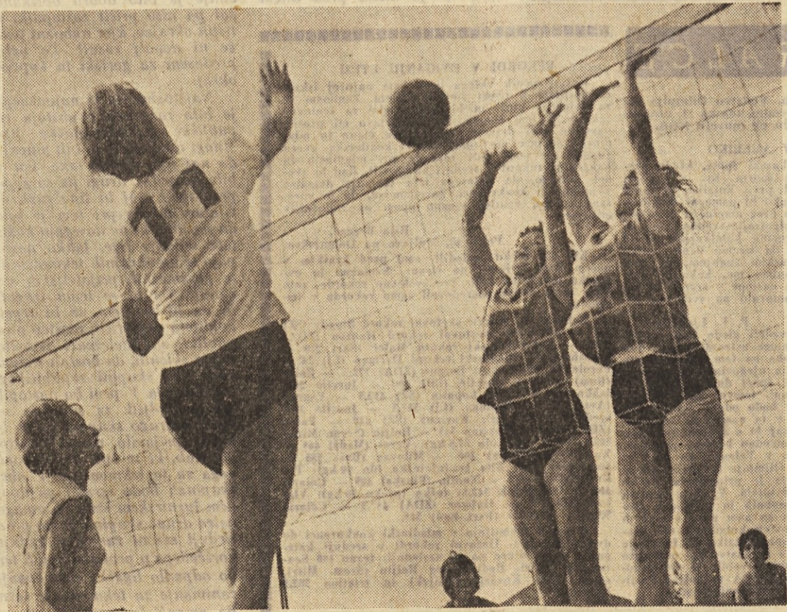
Odbojarska tekmovalja v najrazličnejših ligah so prav sedaj na vrhuncu