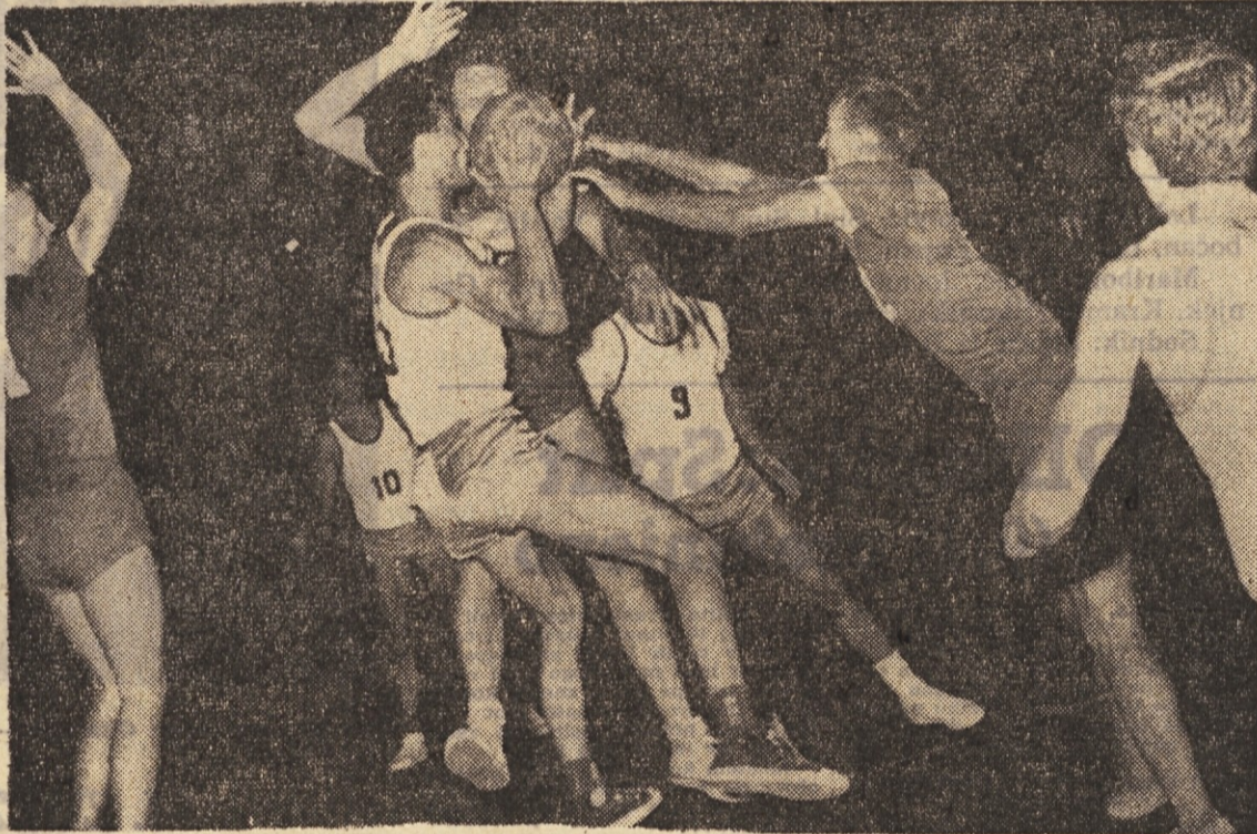
Takšnih in podobnih trenutkov je bilo večeraj zvečer na tekmi med Olimpijo in Zadrom vse polno.

Ilirija in Slovan sta izstopila iz II. zvezne lige, ker ju je to tekmovalje finančno preveč obremenjevalo. Kaj več o tem bomo povedali prihodnje.