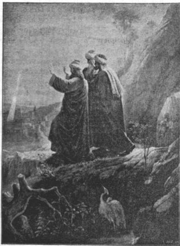
Sveti trije kralji.

koliko solza! Človeško srce res skoraj ne more biti, da ga ne obdaja trnjeva krona. „Obrni se kvišku“, pravi Tomaž Kempčan, „obrni se navzdol, poglej v se, poglej zunaj sebe, na levo, na desno; povsod boš našel križ, bridkost.“ Isto je povedal tudi modri zakonodajalec atenski, Solon, prijatelju, ki mu je potožil svojo bridkost. Pelje ga na goro, odkoder se je videlo celo mesto, Atene. „Glej, to veliko mesto, mu reče, ko gledata mesto pod seboj in vse hiše naokrog. Kaj meniš, koliko reve in bede pač biva pod temi strehami? Oh, ko bi mogel pogledati skozi strehe in videti, koliko trpljenja je v vsaki hiši, bi videl tu strašno revščino in pomanjkanje, tam hudo bolezen, tam nemir in prepir, tam zopet kako drugo težavo. Bodi torej miren in pomisli, da nisi ti edini, ki trpiš.“ Pač res, ni ga človeka, katerega bi nikdar ne zadela kaka bridkost; ni ga stanu, ne spola, ne starosti, ki bi bila obvarovana pred njo. Ta se mora boriti s pomanjkanjem, onega muči huda bolezen. Temu so vzeli hudobni jeziki dobro ime in poštenje, onega preganjajo in mučijo sovražniki. V tej družini se solzijo otroci pri smrtni postelji dobrega očeta, v oni prelivajo starši solze nad razuzdanim sinom, nepokorno hčerjo.