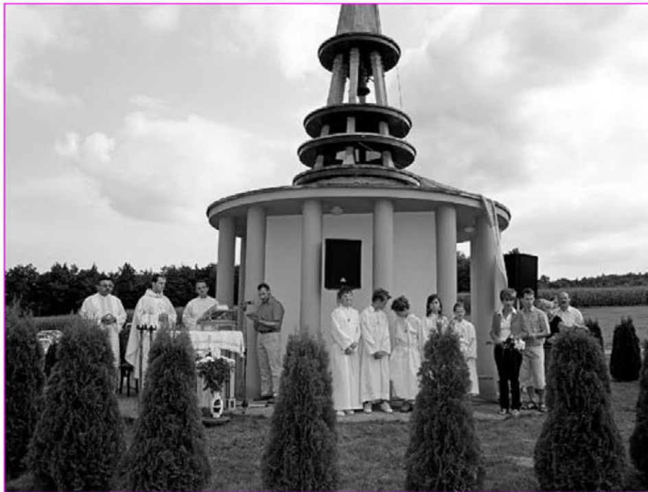
Krajnčeva kapela med slovesnostjo