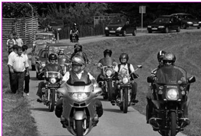
Glavni so se pripeljali s truščem