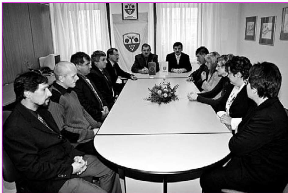
S seje občinskega sveta

Obravnavali so predlog JVIZ Destrnik-Trnovska vas za oblikovanje dveh starostnih skupin v vrtcu ter ceno vrta. Predlagana ekonomska cena JVIZ za 1. skupino (1-3 let) bi znašala 375,64 EUR, ekonomska cena za 2. skupino (3-6 let) bi znašala 310,98 EUR. Svetniki so bili enotnega mnenja, da se oblikujeta dve starostni skupini v vrtcu, cena vrta pa ostane enaka sprejetemu sklepu 5. 9. 2007, to je 307,73 EUR za otroke s stalnim prebivališčem v Trnovski vasi in 339,58 EUR za otroke, ki nimajo stalnega prebivališča v Trnovski vasi. Svetniki so predlagali, da se ravnatelj JVIZ Destrnik-Trnovska vas udeleži naslednje seje OS in razloži zahtevo po različnih ekonomskih cenah.