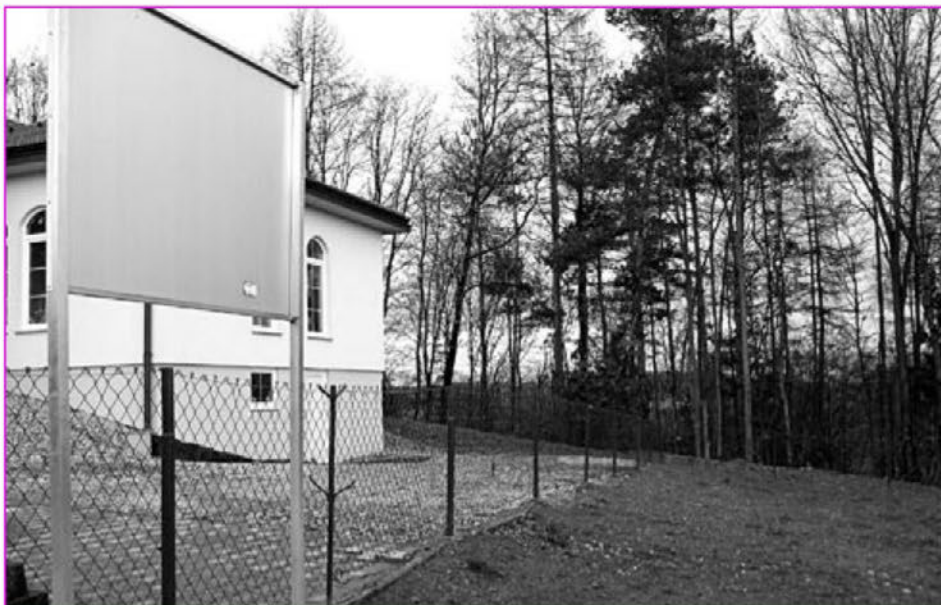
Odstranjene ciprese na pokopališču

Drago Pukšič: Odbor za infrastrukturo je na moj predlog sprejel sklep, kako pravično in enakomerno zagotoviti sredstva za vseh sedem vasi. Za vsako vas smo posebej pregledali koliko metrov ima ne-asfaltiranih cest, nato smo sešteli dolžine cest vseh sedem vasi in delili s sredstvi, ki so bila na razpolago. Tako smo dobili znesek, za vsako vas posebej. Skupni znesek za vzdrževanje javnih in poljskih poti je bil skupaj s pobranim denarjem € na € 22.157 €. Z analizo lahko na kratko predstavim porabo sredstev po vaseh. V naselju Biš je bilo na razpolago 6.223 €. Za gramoziranje se je porabilo 5.787,60 €, za čiščenje jarkov 662,5 €, za košnjo trave pa 100 €. Bišečki Vrh je imel na razpolago 2.620 € razpoložljivih sredstev. Za gramoziranje se je porabilo 1.334,40 €, za čiščenje jarkov pa 367,25 €. Če nadaljujemo s Črmljo . Razpoložljivih sredstev zanjo je bilo 1.444 €, za gramoziranje so porabili 500 € za čiščenje jarkov 100 € in za košnjo trave 160 €. V naselju Ločič se je od 5.352 € razpoložljivih sredstev za gramoziranje porabilo 4.171,80 €, za čiščenje jarkov 937,5 € in za košnjo trave 628,04 €. Potem je bilo za Sovjak namenjenih 944 €. Z gramoziranjem pa se je porabilo 1.080,00 €. Tudi v centru naše občine, torej v Trnovski vasi , je bilo potrebno gramozirati nekaj poti. Name-