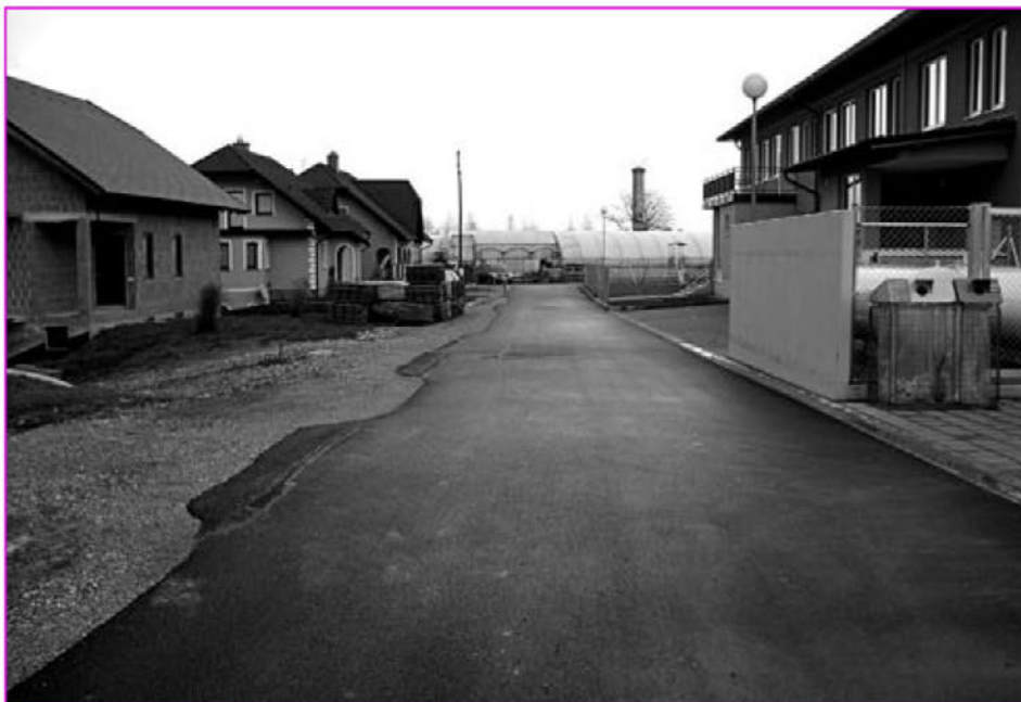
Novogradnja javna pot Trnovska vas - novo naselje

njenih je bilo 2.888 €, za gramoziranje se je porabilo 2.458,20 €, za čiščenje jarkov pa 603,75 €. Ostala mi je še ena vas, to je Trnovski Vrh . Namenjenih je bilo 2.686 €, za gramoziranje se je porabilo 1.834,80 €, za košnjo trave pa 120 €. Iz svojih rezerv sem porabil 777,40 €, ki smo jih uporabili po vaseh, kjer se je moralo še kaj dodatno gramozirati. Za lažjo predstavo vam lahko povem, koliko gramoza je bilo odpeljanega po posameznih vaseh.