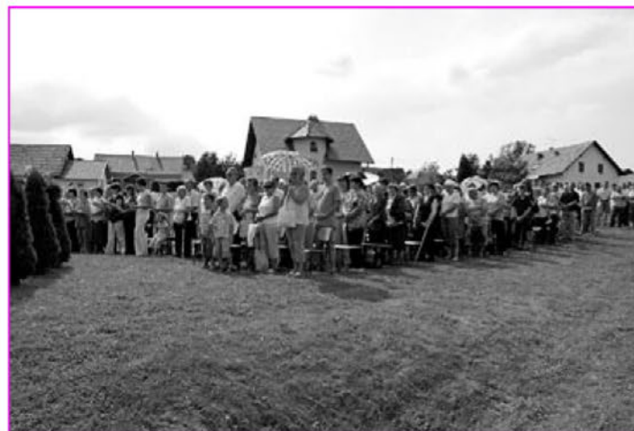
Prisotni med sveto mašo