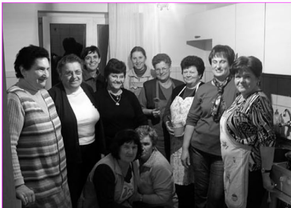
Članice društva kmetic v novi kuhinji

V tem letu nas je občina podprla pri naši dolgoletni želji po društveni kuhinji. Tako so se pričele intenzivne priprave na obnovo kuhinje v lovskega domu, kjer smo dobile v souporabo obnovljene prostore lovskega doma. Ob finančni podpori občine in s soglasjem Lovske družine Trnovska vas, se je obnova prostorov čez leto uspešno zaključila. Tako smo v četrtek, 29. novembra z uradnim srečanjem in podpisom pogodbe pričele delovati v obnovljeni kuhinji lov-