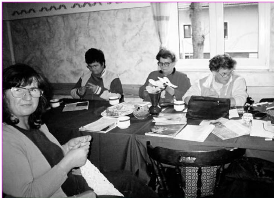
Umetnice pri delu

V naši družbi je prijetno, saj nas izdelovanje in ustvarjanje novih izdelkov ob klepetu ter dobri volji veseli in sprošča. Seveda pa je za naše druženje ob kvački in prejici obvezna tudi kavica.