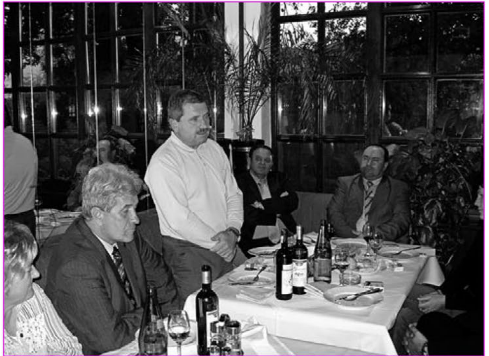
Obisk pri županu občine Ilidža

Sarajevo je bilo okrog 1450 dni v obroču