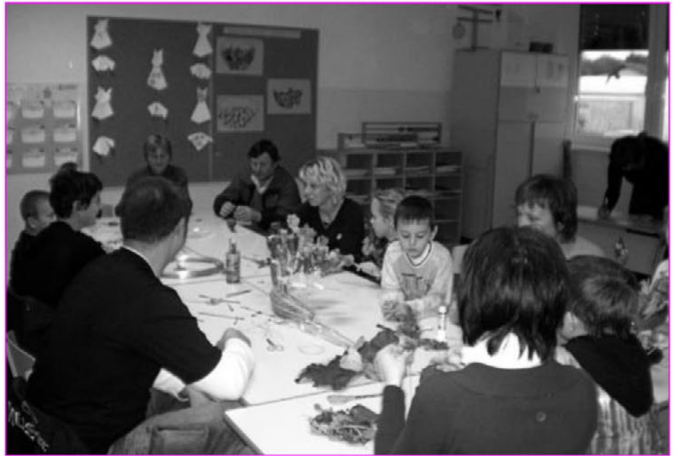
Starši, otroci in učiteljci pri delu

Vzdušje v vseh skupinah je bilo enkratno. Vsi so izdelovali z veliko vnemo in dobro voljo. Nastali so čudoviti izdelki, ki so jih posamezne skupine razstavile. Zvitki, ki so jih spekli učenci, starši in mentorici, pa so