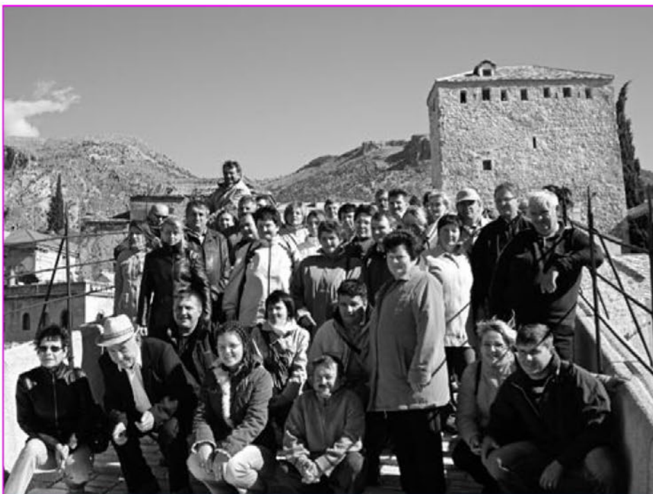
Na mostu v Mostarju

Drugi dan nas je pot peljala do Mostarja. Pogled na okolico na poti iz Sarajeva v Mostar je bil podoben, kot pot do Sarajeva, kjer vidiš na tisoče poškodb od projektilov vojne in številne ruševine. V Mostarju smo si ogledali samo mesto, zatem znameniti most v Mostarju, ki je bil v času vojne porušen in je ponovno novo zgrajen v arhi-