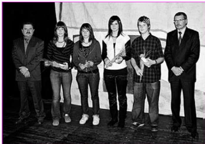
Letošnji dobitniki zlatih petic