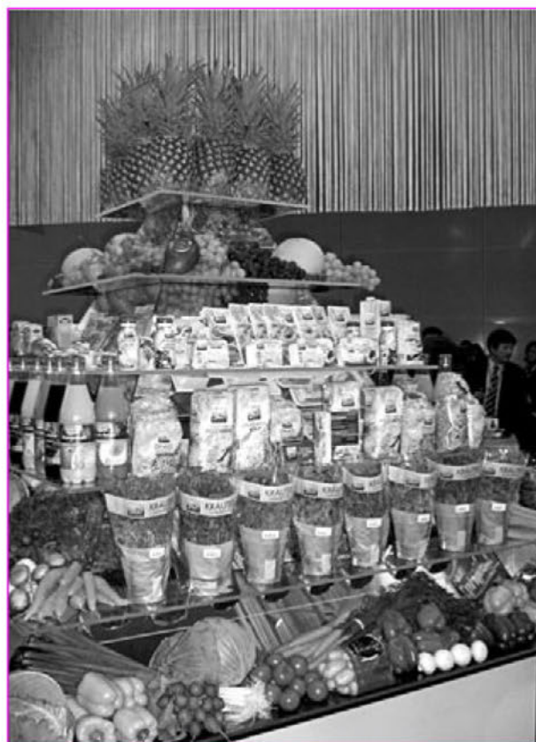
Pogled na eno izmed stojnic s sadjem

Ker vse lepo hitro mine, so tudi meni ti