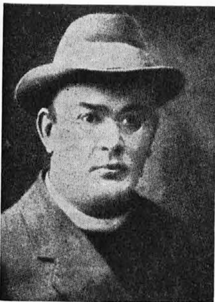
Dr. Janez Evangelist Krek, glavni pobudnik in tvorec Majniške deklaracije

Val nacionalnih in liberalnih revolucij je že od leta 1815 zajemal Evropo. V marčni revoluciji 1848 pa je zajel tudi Avstrijo, katero je dolgo let dušil Metternichov absolutizem. S tem letom je bila odprta politična pot tudi »nezgodovinskemu« slovenskemu narodu. Slovenski kmet je v pomlad narodov dosegel le osvoboditev od graščine, meščani, zlasti pa izobraženci pa so prevzeli politično vodstvo in iskanje novih obzorij.