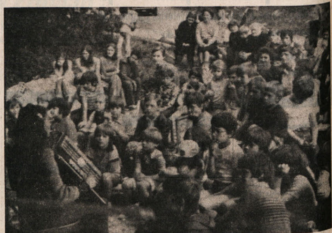
Vestno pripravljane za nastop na «Mladi briezi»

«Dobro vičar. Začnemo naš praznik in pozdravimo starše, Tarbjane in vse te druge, ki sta paršli. Kar smo bli tle na Mladi briezi, smo se spoznal in priet ku iti na muorje, smo misleni narost an praznik za pasat no vičar vsi kupe.»