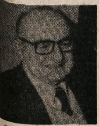
Obrambni minister Lattanzio

RIM — Če se je pred nekaj dnevi, med sejo senatne komisije, obrambni minister Vito Lattanzio nekako neboljen in slabo informiran, je treba tokrat reči, da ni prepričan. Kljub vztrajnim povpraševanjem, naj vendarle pojasni nekatera vidna protislovja v zvezi s Kapplerjevim begom (za katerega se vedno ne ve, kako je usel, ali ga kdo videl) in polemiki o njegovi politični odgovornosti, je minister ubral najlažjo, čeprav tvegano pot: skoraj dobesedno poročilo izpred dveh dni in dodal je nekaj novih odstavkov. Lattanzio je torej potrdil, da so po njegovem vsega krivi karabinjerji, ki so bili zadoščeni, da Kapplerja izročijo v obdobju vojne klinike. Levicarski poslanci in tisk so namreč dali razumeti, da je morda sklep o Kapplerjevi premostitvi bil preurjen in da ga niso spremljali namočeni zdravniki izvidi. Lattanzio pa je moral parlamentu dokazati, da so Kapplerja premostili v bolnišnico, ker ta ustreza določilom o humanem ravnanju z jetniki, ki jih vsebuje ženevska konvencija o vojnih ujetnikih.