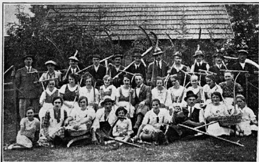
S tekme koscev DKFID Sv. Jurij ob Ščavnici

Graditev doma se bo v najkrajšem času pričela in vsak najmanjši dar je dobrodošel.