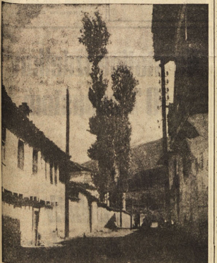
Ulica v Debru

(Od našega dopisnika) BEOGRAD, 30. — Malo mesto Makedonije Debar, ki leži blizu jugoslovansko-albanske meje 90 km zahodno od Skopja in 70 km vzhodno od glavnega mesta Albanije Tirane, je doživelo danes zjutraj okrog 8.30 podobno katastrofo kot pred leti Skopje.