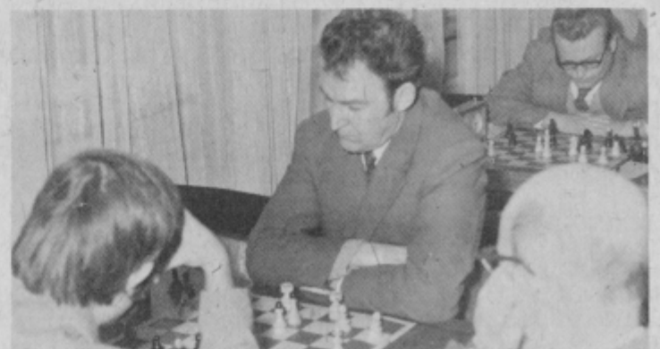
Ptujski šahisti med igro

najboljšimi. Prva slovenska šahovska liga se deli na vzhod in zahod. V obeh skupinah igra osem ekip. Zmagovelnica na koncu igrata med seboj za republiškega prvaka, v vsaki skupini pa zadnja dva izpadeta in se nadomestita z zmagovalci druge republiške lige.