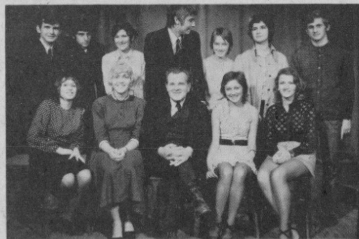
Dijaki in igralci hkrati in to zelo dobri