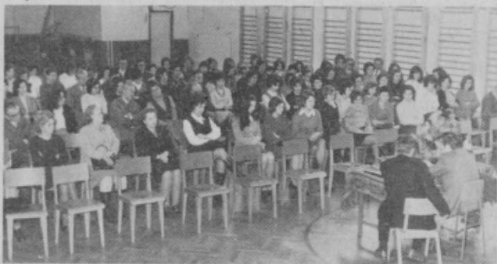
Udeleženci seminarja so se namestili v novi telovadnici osnovne šole Tomaž.