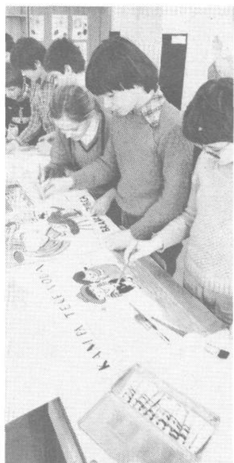
Na šoli imajo veliko izvenšolskih dejavnosti. Tako učenci lažje odkrivajo svoje sposobnosti.