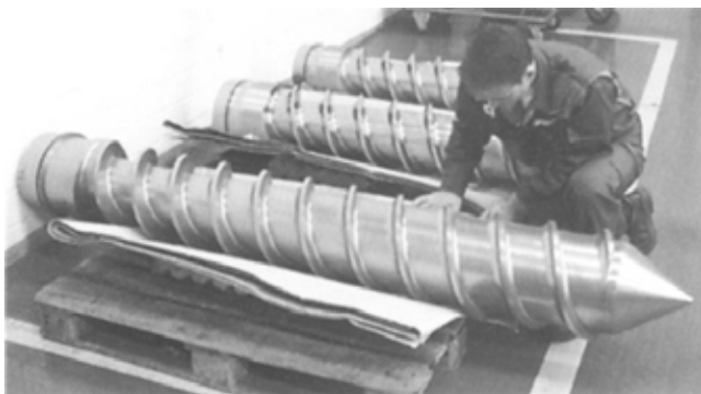
Slika 2: Polž za ekstruzijo PVC, zaščiten z dupleksnim postopkom: kombinacija plazemskega nitriranja in nanosa PVD-prevleke (v tem primeru je bila to večplastna struktura na osnovi CrN.)

PVD-prevlek za zaščito pred močno abrazijsko obrabo so noži za peletizacijo in polž plastifikatorja (slika 2).