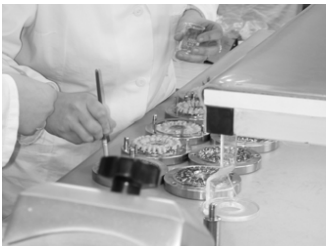
Slika 3: Matrice iz elektrolitskega niklja, ki smo jih zaščitili z nizkotemperaturno CrN-prevleko, v proizvodnji zob iz polimetilmetakrilata (PMM) v podjetju Polident (Volčja Draga pri Novi Gorici)

V nekaterih primerih dosežemo zadovoljivo zaščito orodij za oblikovanje plastike le s kombinacijo