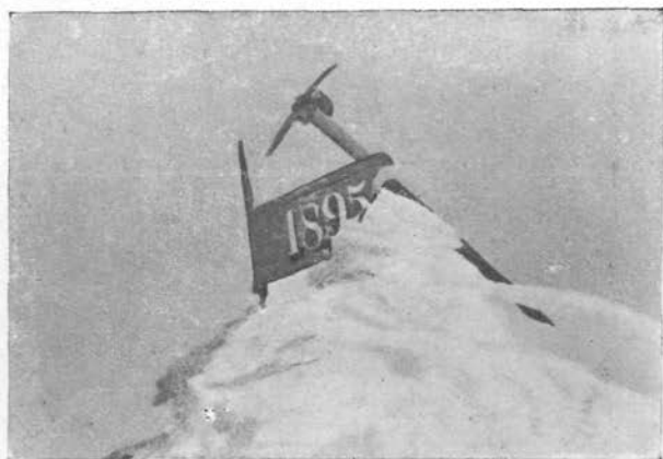
Aljažev Stolp pod snegom.

da sem krenil na napačno pot, namreč proti Dednemu Polju; pa kmalu sem spoznal zmoto in se vrnil do križ- potja. Odslej sem bolj pazil na pot, ki je bila na me- stih — zlasti v gozdu — hudo razrita. Ko se pa konča gozd, se ti odpre krasna planina Voje, po-