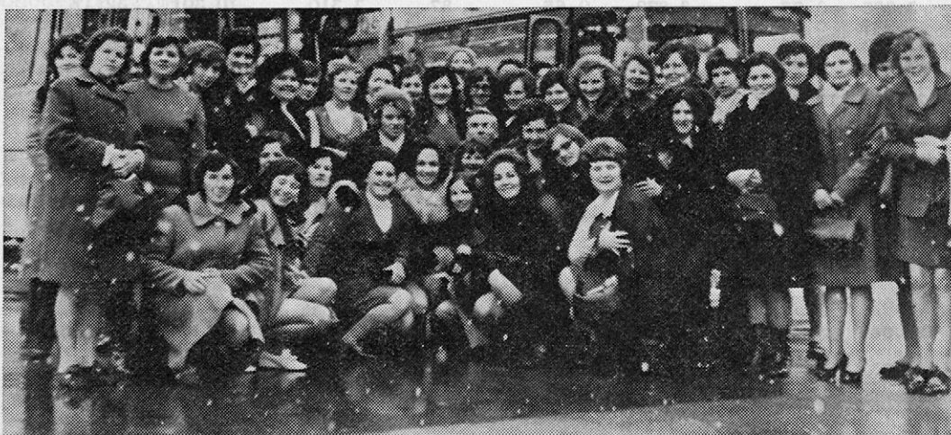
Delavke Budućnosti na obisku v naši tovarni