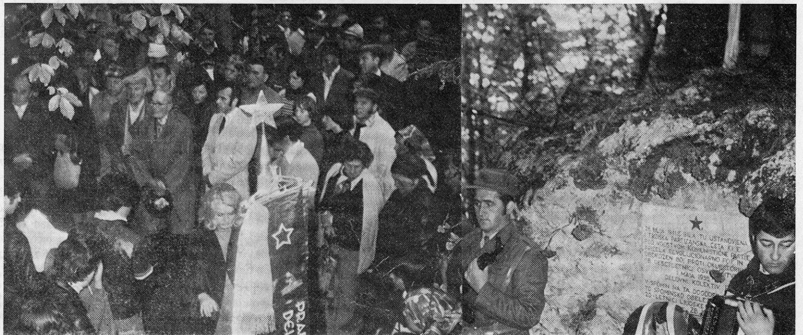
Udeleženci proslave na Čevdrcih

O vseh nepravilnostih je izdal inšpektor za delo zapisnik in odločbo, ki nam nalaga kaj je potrebno urediti za varnejšo delo in roke ureditve teh pomanjkljivosti. Za čim boljše in hkrati poceni preureditev delovnih pogojev v varnejše so pomembni tudi konkretni predlogi delavcev na svojih delovnih mestih pot predlogih teh, ki bodo preureditev izvajali. S tem bomo za varstvo pri delu lažje rekli, da je potrebnih spremljevalec in ne zaviralni privesek našemu delu.