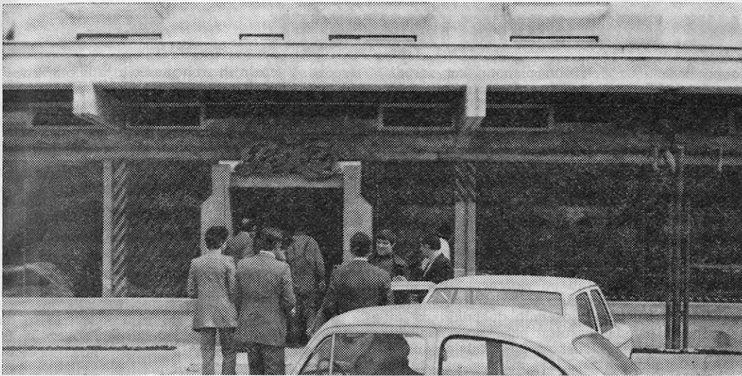
Prodajalna v Sevnici