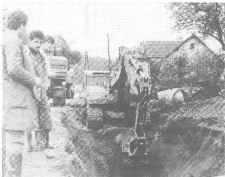
Delavci TOZD kanalizacija že gradijo kanal me križiščem na Škofljici in novo osnovno šolo. Kot napovedujejo v komunalni skupnosti, bodo dela zaključena do konca leta