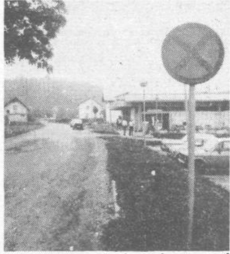
S pločnikom na desni strani ceste proti Notranjim Goricam bi močno povečali prometno varnost pešcev in otrok

Še enkrat so prisotni namenili pozornost domačim gasilcem. Ti so ob 85-letnici društva prejeli avtocestno. Vnanjanci in gostje so tudi tokrat