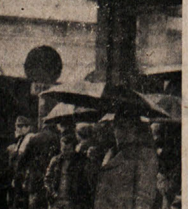
Prizorišče včerajšnje nesreče v Ul. P. Diacono