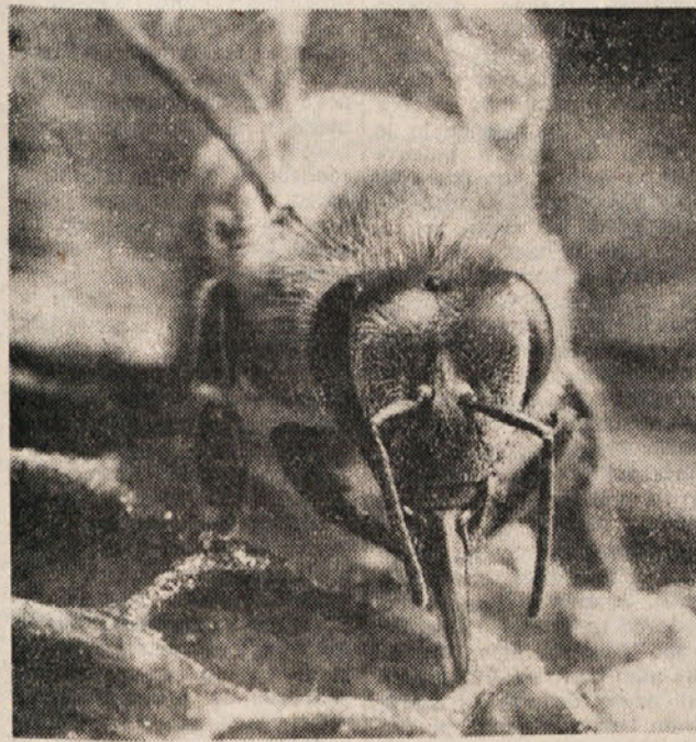
»ZASLUŽIM SI VEČ POZORNOSTI!« Fotodokumentacija Dela

Čebelarji so opozorili tudi na podatek, da so letos v Volvodini dosegli v svetovnem merilu največji pridelki sončnice: »Res so dosegli tak pridelki z novimi semenom, toda tudi s pomočjo čebel, saj so Volvodinci zelo aktivni čebelarji so razložili in pokazali na tabelo, ki so jo prinesli iz tujine. Podatki so zgornji. Pridelki hrušk se lahko povečajo za 36 odstotkov, če je na 1 hektar sadovnjaka 6 panjev, s šestimi panji na 1 hektar se poveča pridelki za 38 odstotkov, s sedmimi panji na 1 hektar se poveča pridelki za 43 odstotkov, s petimi panji na 1 hektar pa se pridelki jagod dvigne kar za 55 odstotkov. Podobne številke veljajo za druge sadeže in pridelke. Kaj vemo v tem pri nas?