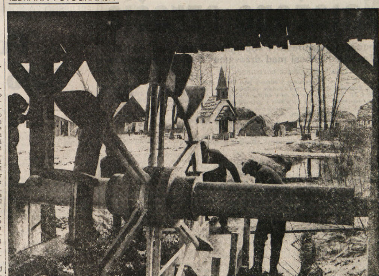
Prekmurska vas na ljubljanskem Barju LJUBLJANA, 10. jan. — Pri vasi Brest na ljubljanskem barju so filmarji postavili pravo prekmursko vas z 21 hišami, značilnim mlinsom, gospodarskim postopij in cerkvijo. Nekaj hiš so celo prekrili s slamo. Tu bo naslednji teden Viba film snemal novi film z delovnim naslovom »Prihod pomladi.«