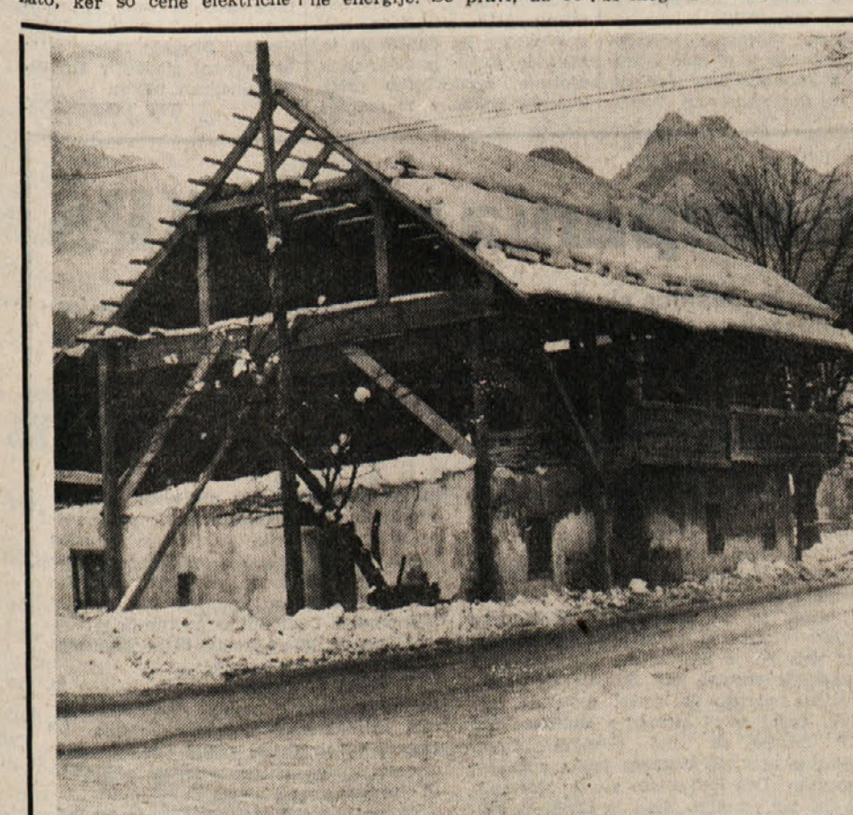
Iztrgana zobu časa KRANJSKA GORA, 11. jan. — Ze v začetku svoje srednjeevropske obdobja so kulturni delavci in delavci spomeniškega varstva začeli z odločno akcijo za obnovitev Lizne dolge hiše v Kranjski gori, ki je edini primer kmečke arhitekture v Gornjesavski dolini. Doslej so v obnovi vložili približno 700.000 dinarjev, vendar pa vsa ta sredstva še niso porabili. Dobro polovico denarja je prispevala kulturna skupnost Jesenice, ostalo pa kulturna skupnost Slovenije. Dela naj bi končali v prihodnjem letu. Ko bo hiša spet pridobila nekdanjo podobo, bodo v njej odprli stalno razstavo kmečkega orodja tega konca, knjižnico s čitalnico, v njej pa bodo našli prostore za svoje dejavnosti tudi domači kulturniki in krajevna skupnost. V. F.

Pogostoma je slišati mnenja, da bi morali potrošnike, če se homo odločili za takšno usmeritev, celo spodbujati, da bi se ogrevali z električno energijo. Vode in premog imamo namreč doma, za uvoz surovine nafta pa bomo morali samo letos zagotoviti skoraj 1,2 milijarde dolarjev. Domača nafta nahajališča nam bodo lahko dala komaj dobro četrtino potrebnih količin. Vsekakor pa zahtev gospodinjstev kot potrošnikov vsih vrst energije, tudi električne, ni mogoče zanemariti.