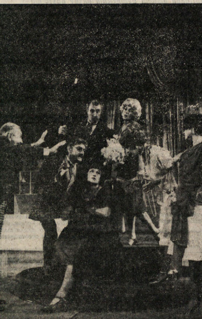
Prizor iz drugega dejanja Nušičeve komedije »Oblast«, ki jo je tržaško Stalno slovensko gledališče pripravilo v režiji Miroslava Belovića iz Beograda.