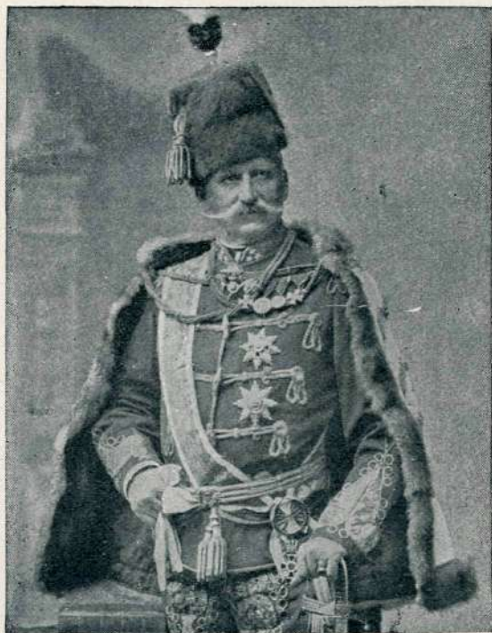
Geza pl. Fejervary, novi ogrski ministrski predsednik.

Vpliv Italije je bil silno močan tudi na Dunaj, in ta vpliv je šel čez naše kraje. Zato je za nas važno posebno to, kar piše gospod pisatelj o cerkveni glasbi v akvilejskem patriarhatu. Cerkev je dala s sveto mašo, z breviarijem in z liturgičnimi spevi mnogo novih elementov za razvoj narodne in umetne pesmi, ker je pri bogoslužju sodelovalo tudi ljudstvo. Tudi ljubavne latinske pesmi so bile tedaj često prikrojene po vzorcu cerkvenih himnov. Gospod pisatelj razpravlja potem, kako so cerkvene pesmi vseh vrst, zložene za razne cerkvene čase in pobožnosti, prihajale med ljudstvo.