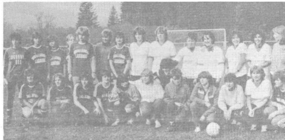
Čprav je moški nogomet tisti, ki privlači tisoče gledalcev na igrišča, pa so igralkice z Dobrove in iz Železne Kaple tudi pokazale, da znajo močno, odločno in točno brcniti žogo