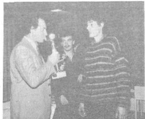
Kapelski podžupan je počastil zmagovalno ekipo s pit-jem vinjaka iz pokala

Morda so nogometašice in nogometaši NK Dobrova, OK ZSMS Ljubljana Moste-Polje in krajevnega združenja zveze slovenske mladine iz Železne Kaple preveč prezivali lepi nedeljski