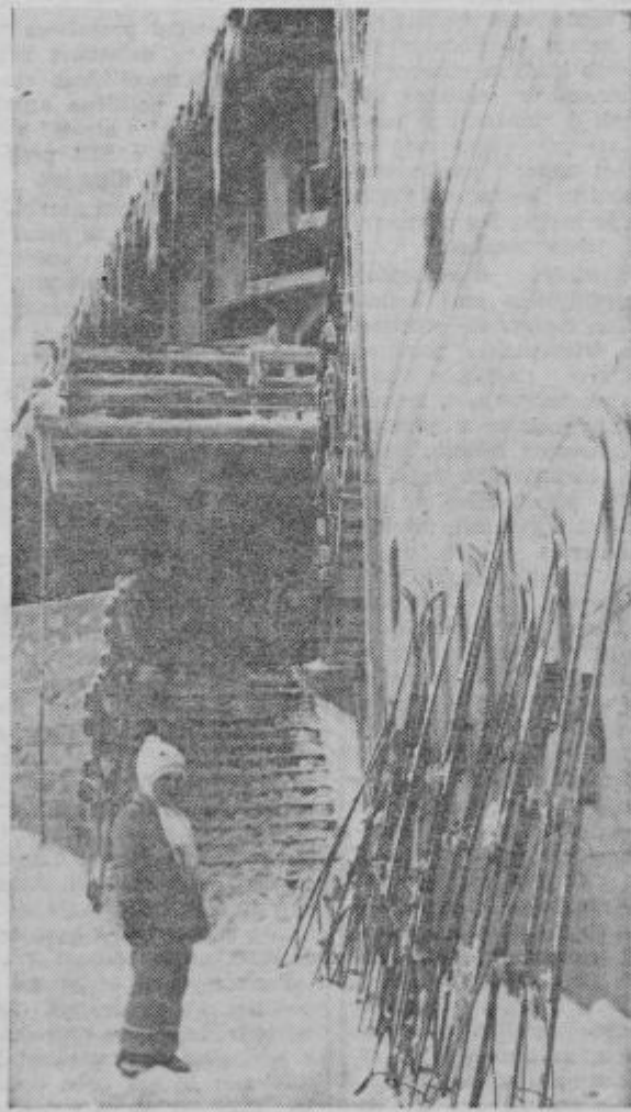
Golte — koliko smučk . . .

Vsekakor pomembni dogodek, ki je v mednarodnem zdraviliškem turizmu še precej redek in izjemen.