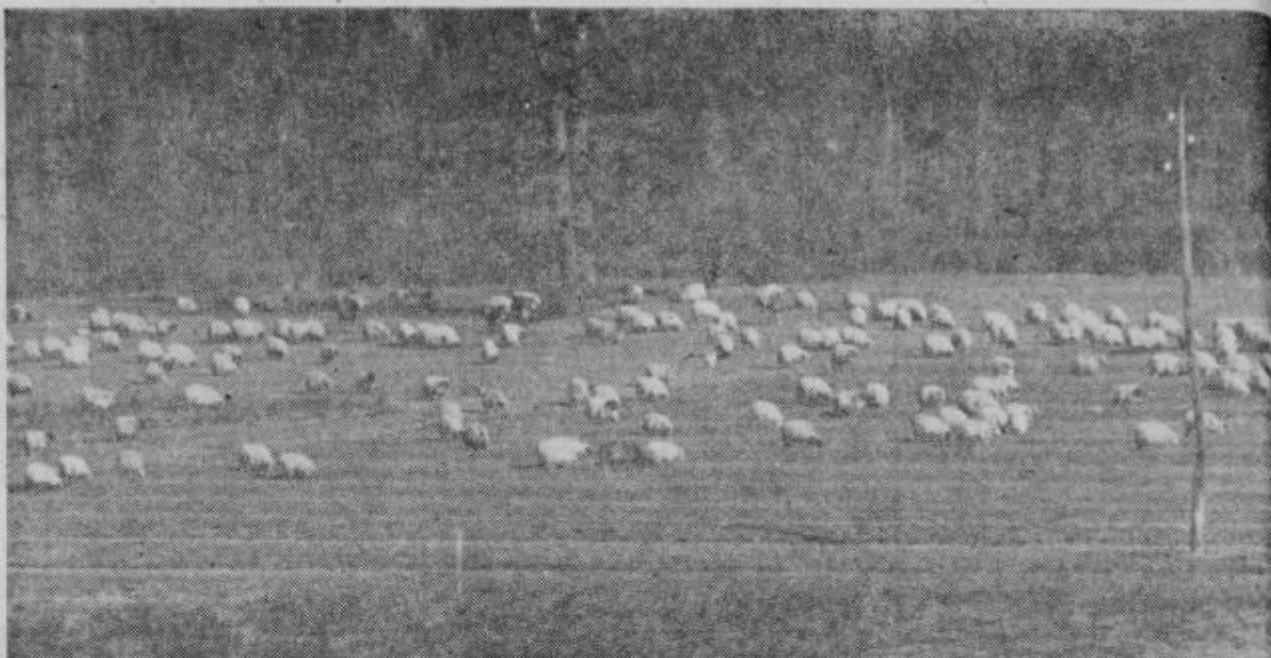
NOMADI PRIHAJAJO. V Obsotelju (pri Golobinjeku) se v tem času nudi takle »starodaven« prizor. Velikanska čreda ovac je priprtovala z juga in se ohranja pri življenju s skromnimi obroki suhih travnih šopov. Bajje je ovčarsko nomadstvo postalo predmet zamotanih sporov, vsekakor pa enostavno to ni, če je bila problemu posvečena ena od oddaj o Gruntovčanih.

Nabavo omenjenih in še nekaterih drugih strojev investira zadruga preko svoje kreditno hranilne službe.