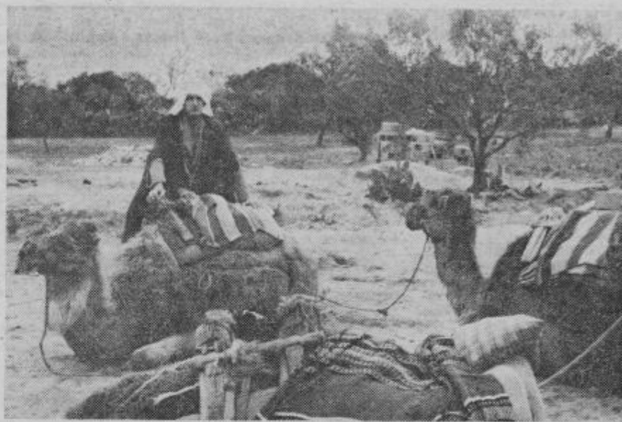
Avtor tega zapisa ob svoji Selmi

Ze takoj ob našem prihodu so postali pozorni na nekatere naše besede in po prebitju začetne treme so nas vprašali, kaj recimo pomeni »dobro jutro«. Razložili smo jim, oni pa so se obrnili v stran, izvlekli beležko in si to zapisali. Naslednji dan so nas že pozdravljali z »dobro jutro, kako ste, lahko noče in podobnim. Ko smo jih vprašali, zakaj vse to, so povedali, da je pri njih vedno več gostov