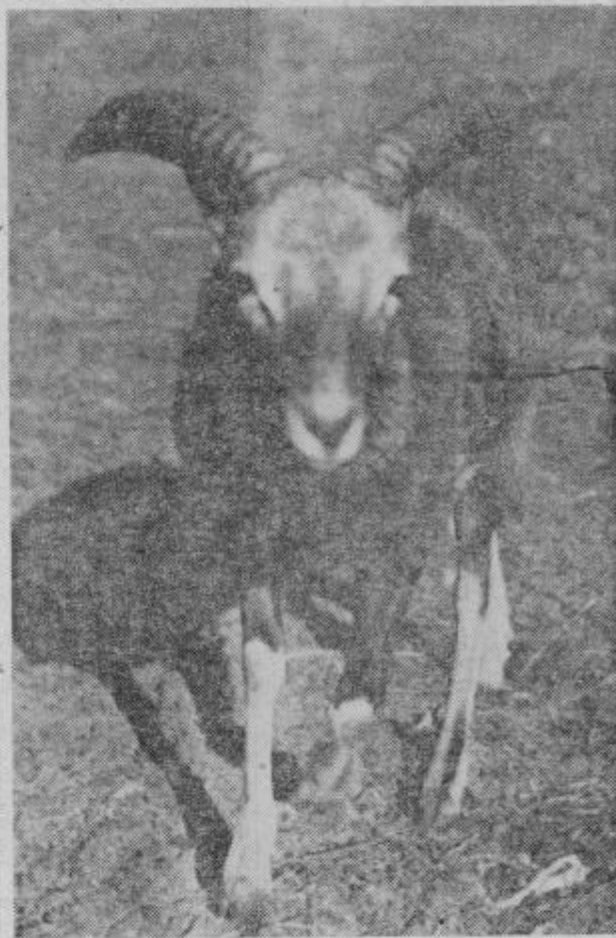
Muflon. Niti leto dni še nima. Lovci ga je rešil pogin. Vzredil ga je in zdaj je že goden, da gre nazaj v gozdi k svoji divji muflonski tropi. Ker pa se tej noči pridružit, ga lovska družina Solčava želi prodati.