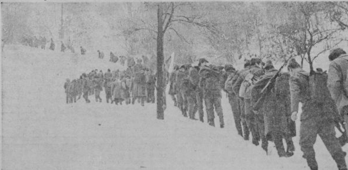
Kolona stopetdesetih pohodnikov se je zagrizla v naslednjo strmino. Globoko v sebi so čutili, koliko slabše je bilo za borce legendarne štirinajste. Na sliki je del kolone ob vznožju Graške gore.