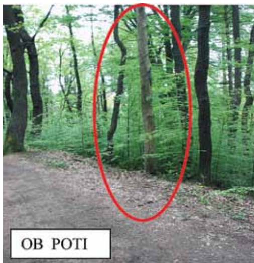
Slika 3: Suho drevo ob poti