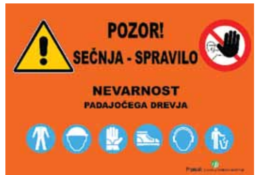
Slika 5: Označba za delo v gozdu, dosegljiva za tisk na spletni strani Zavoda za gozdove Slovenije (Označba za..., 2009)

Ena izmed tem, ki nas je zanimala, je bila tudi označba za delo v gozdu. Na spletni strani Zavoda za gozdove Slovenije si lahko lastniki in izvajalci del natisnejo opozorilno označbo za delo v gozdu.