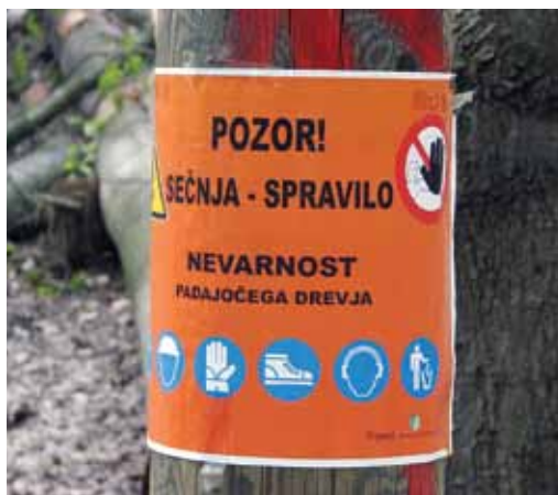
Slika 2: Fotografija označbe za delo v gozdu

Na fotografiji je označba za delo v gozdu. Kakšno je Vaše mnenje?