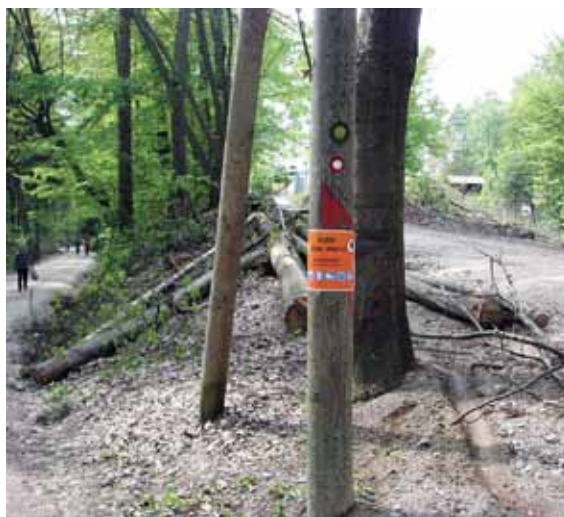
Slika 1: Fotografija označbe za delo na Golovcu

Na fotografiji je označba za delo v gozdu. Kakšno je Vaše mnenje?