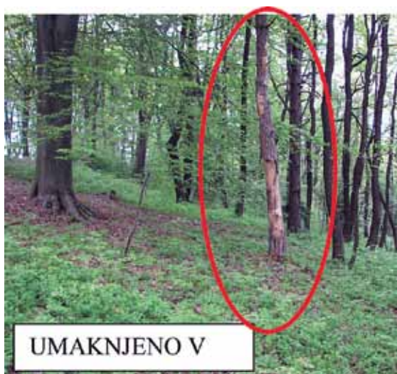
Slika 4: Suho drevo, ki ni neposredno ob poti.

Preglednica 16: Odgovori anketiranih o poseku suhega, odmrla drevesa, ki ni neposredno ob poti.