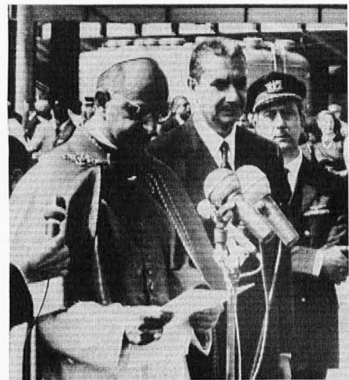
Aldo Moro, tedaj ministrski predsednik, sprejema papeža Pavla VI., ki se je pravkar vrnil iz New Yorka, kjer je 4. oktobra 1964 govoril pred skupščino Združenih narodov

Te vrstice naj ne izvenijo kot brezpredmetna polemika, pač pa kot dolžna opomba na račun te TV-oddaje in njene programacije. SPECTATOR