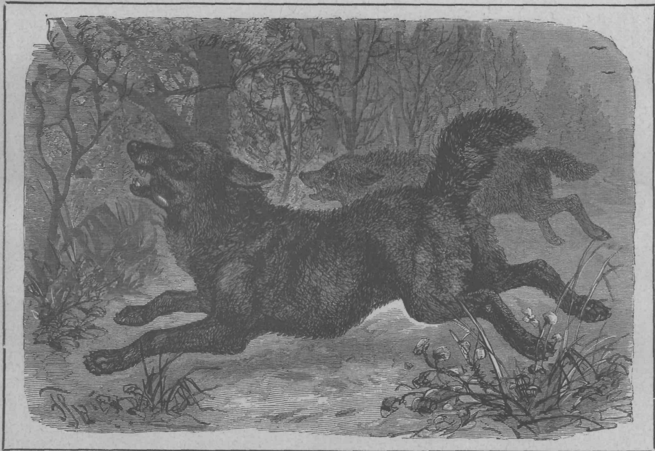
Volk. (Canis lupus.)