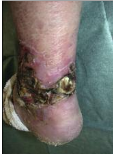
Slika 1. Bolnik s senzorično nevropatijo in nebolečo razjedo velikosti 10×10 cm na spodnjem delu goleni.

Glede na domača in mednarodna priporočila je treba vsakemu bolniku s SB vsaj enkrat letno pregledati noge (1, 4, 5). Pregled nog oz. presejalni test obsega usmerjeno anamnezo, oceno deformacij, oceno prekrvitve in oceno občutljivosti kože. Namen presejalnega testa za diabetično nogo ni niti postavljanje diagnoze nevropatije niti diagnoze periferne žilne bolezni, ampak želimo z njim v populaciji bolnikov s SB aktivno poiskati tiste, ki so ogroženi za nastanek razjede na nogi. To so v prvi vrsti bolniki z motnjami občutljivosti, motnjami arterijske prekrvitve in tisti, ki so v preteklosti že imeli razjedo na nogi. Dokončna potrditev suma na nevropatijo in periferne žilne bolezni presega okvir presejalnega testa.