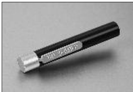
Slika 3. Tip Therm® – pripomoček za ugotavljanje občutljivosti za toploto/hladno.

Ziegler in sodelavci so pokazali, da je oslABLJENA občutljivost za toploto in hlad najpomembnejši zgodnji simptom distalne simetrične polinevropatije (14). Tip Therm® je enostavno in poceni diagnostično orodje za ugotavljanje motenj občutljivosti za toploto in hlad (slika 3). Sestavljen je iz dveh delov – kovinskega in plastičnega. Kovina in plastika izzoveta različne občutke toplote na površini kože, čeprav ju imamo na enaki (sobni) temperaturi: zaradi večje prevodnosti za toploto potegne kovinski del iz kože več toplote kot plastični, zato ga zdrav preiskovanec občuti kot hladnejšega v primerjavi s plastičnim. Ker posredujejo zaznavo toplote in hladu druga živčna vlakna kot zaznavo dotika in vibracije, dobimo s tem dodatne informacije o stanju perifernega živčevja (13, 15).