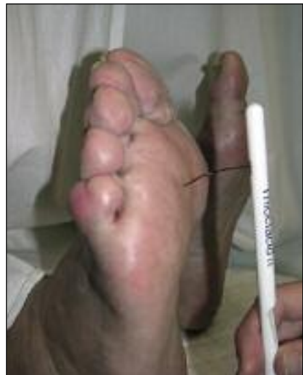
Slika 2. Preizkus občutljivosti za dotik s standardiziranim 10-gramskim Semmes-Weinsteinovim monofilamentom.

za vibracijo z bioteziometrom (6–9). Z uporabo več kot ene metode je občutljivost za odkrivanje diabetične distalne simetrične motorične in senzorične polinevropatije več kot 87 % (10–13).