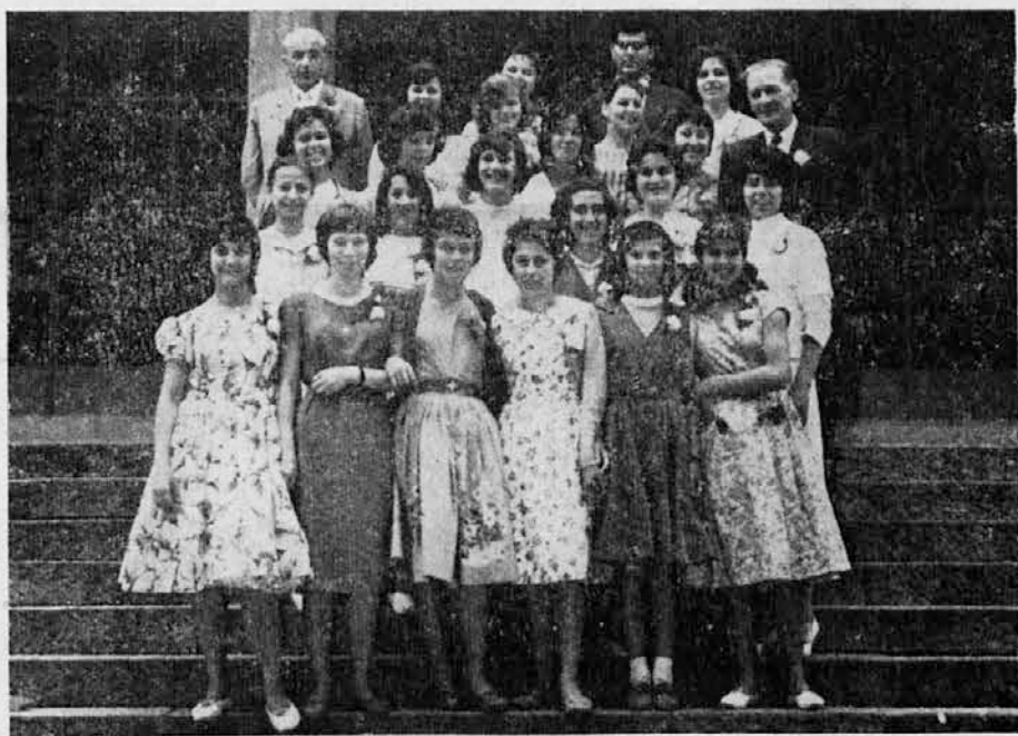
POKOJNIK MED MATURANTI NIZJE T RGOVSKE SOLE V TRSTU