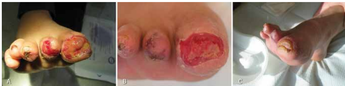
Slika 3a, b, c: V primeru globokih omrzlin in neustrezne oskrbe poškodovanca je potrebno opraviti amputacije mehkih tkiv in kosti (prsti desne noge 1 teden, 4 tedne in 8 tednov po amputaciji).

enoteni, pri čemer osrednje mesto zastopa hitro ogrevanje omrzlih prstov. V Sloveniji so ti ukrepi znani že več kot petnajst let in so sestavni del poučevanja kandidatov na izobraževanjih iz PP. 13,23,24 Kot preprosto, a pomembno posebnost smo v Sloveniji na podlagi znanja patofiziologije omrzlin in objavljene literature v PP uvedli jemanje 500 mg acetilsalicilne kisline dnevno v primerih, ko lahko laik zanesljivo izključi preobčutljivost na to zdravilo. 13 V naši seriji je devet bolnikov (82 %) prejelo ustrezno PP v celoti. Pri obeh alpinistih (18 %), ki PP nista prejela, so bile kasneje potrebne amputacije prstov nog. Razlog za opustitev PP pri njiju so bile težke vremenske razmere na terenu. Upoštevati moramo, da omrzline velikokrat nastanejo v okoliščinah, ko imajo lasten varen sestop, zdravljenje drugih stanj (poškodbe, splošna podhladitev) ali celo reševanje življenja prednost pred izvajanjem PP. 13,18 Na podlagi raziskav o učinkovitosti različnih nesteroidnih antirevmatikov priporočajo nekateri avtorji v okviru PP in NMP zamenjavo acetilsalicilne kisline z ibuprofenom. Ibuprofen ima poleg vpliva na presnovo arahidonske kisline še učinek na fibrinolizo. 25 Izsledkov študij različnih kombinacij antiagregacijskih substanc (npr. acetilsalicilne kisline + dipiridamola) pri omrzlinah še nimamo.