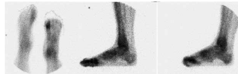
Slika 1b: Scintigram ireverzibilne omrzline; 1: tkivna faza, plantarni posnetek – distalni del levega stopala se ne prikaže, označen je zunanji obris stopala; 2: kasna faza, stranski posnetek, neomrznjeno desno stopalo; 3: omrznjeno levo stopalo, falange se ne prikažejo.

samo sebe (začarani krog), ko porast viskoznosti krvi kot posledice delovanja mraza mikrocirkulacijo še oslabi, kar pomeni dodatni padec temperature tkiva in še večjo viskoznost krvi. 12 Omrzline se subjektivno kažejo s parestezijami in področji anestezije, objektivno pa z lokalnim edemom podkožja, bistrimi in/ali krvavimi mehurji ter mrtvinami tkiva. 13 Klasično delitev klinične