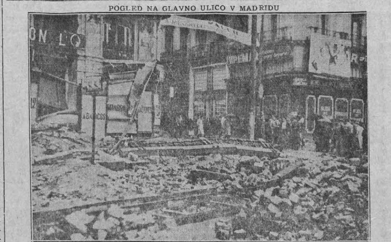
Del glavne ulice v Madridu, takozvana Puerto del Sol, ki teče skozi sredino mesta. Kakor drugim delom mesta vojna tudi tukaj ni prizanašala in na sliki vidimo razvaline, ki jih je povzročila bomba, vržena iz uporniškega aeroplana.