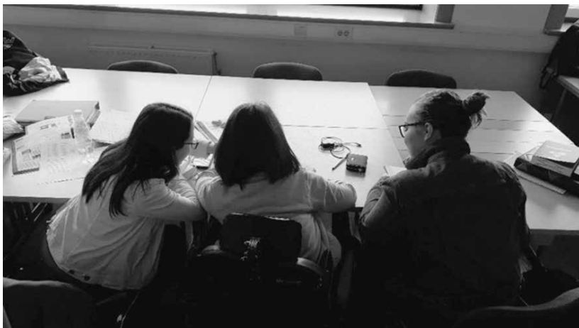
Slika 2: Sodelovanje dijakinj z gibalno ovirano dijakinjo

informacijskega znanja (KIZ). KIZ obsega spoznavanje in uporabo šolske knjižnice, spoznavanje in uporabo različnih tipov knjižnic, usposabljanje za samostojno iskanje informacij s pomočjo kataloga COBISS/OPAC ter navajanje na pravilno citiranje in navajanje virov in literature.