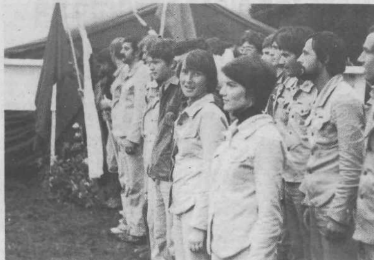
Nasmešek za spodbudo na samem začetku akcije.