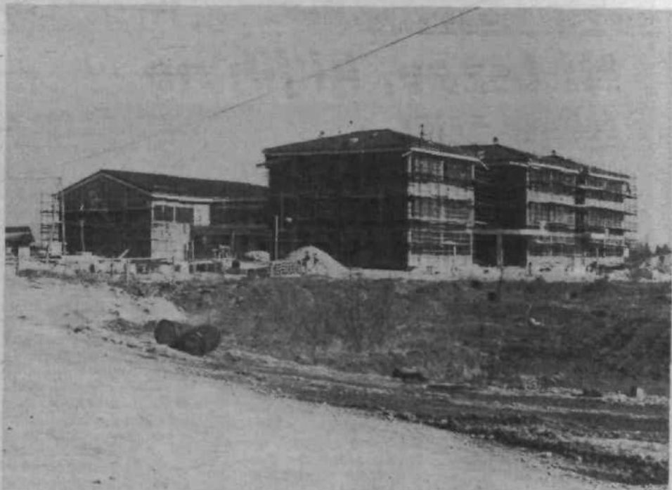
ŠE ENA ŠOLA IZ SAMOPRISPEVKA – Vzgojni zavod Janeza Levca se bo jeseni preselil v nove prostore za Bežigradom. Predvidevajo, da bo gradnja končana že junija, v začetku julija pa bo tehnični prevzem. V napovedih se verjetno niso zmotili, kar dokazuje tudi zunanji videz zgradbe.

občanov. Začetna skupina je štela 16 varovancev, danes pa jih je okoli 80 v dnevnem varstvu in usposabljanju.