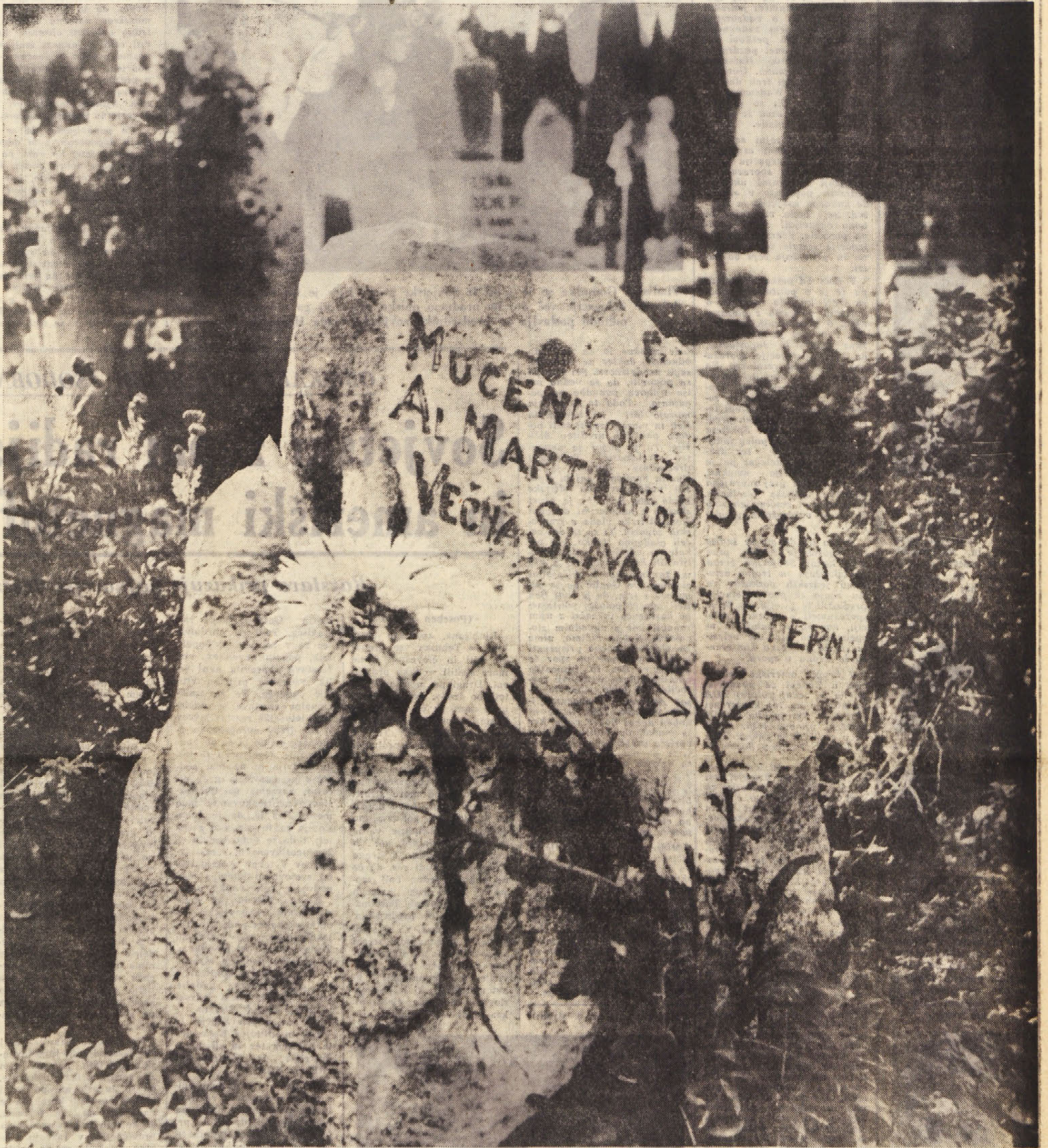
Včeraj in danes se svojci spominjajo svojih dragih pokojnikov in krasijo njih grobove s cvetjem. Naše misli pa so še posebno posvečene spominu vseh tistih, katerih dejanja so v naših sreih vklesala neizbrisni spomenik. Ponovno smo jim izkazali hvaležnost z okrasitvijo njih grobov in njim posvečenih spomenikov po vseh naših krajih in vaseh

Vendar pa je prva poslanica preko vatikanskega radia, ki jo je prebral novi papež nadvse pomembna. Njegov poziv na prenehanje oroževanja, na sporazum med narodi, na sodelovanje in mir, je nalete na ugoden komentar in odmev v Sovjetski zvezi. Moskovski radio je poudarilo, da mimo teh pozivov ni mogoče, kajti sprico vprašanja miru ne more biti svet razdeljen na katoličane in nekatoličane, verne in brezverne, temveč samo na ljudi, ki imajo dobro voljo, da se obrne na mir, in na ljudi, ki le dobre volje nimajo. Lahko torej rečemo, da sta papeževa poslanica in sovjetski komentar nanjo pri spevek k ublažitvi sedanjega mednarodnega, še vedno napetega ozračja.