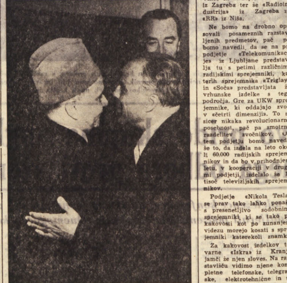
Vodja maroške stranke Istiklal je prinesel predsedniku tunizijske vlade Burgiba osebno pismo maroškega kralja...