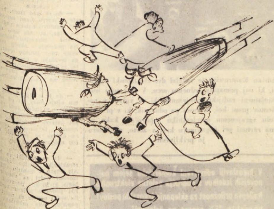
Občutki človeštva ob srečanju tistih, ki odločajo o njegovi usodi