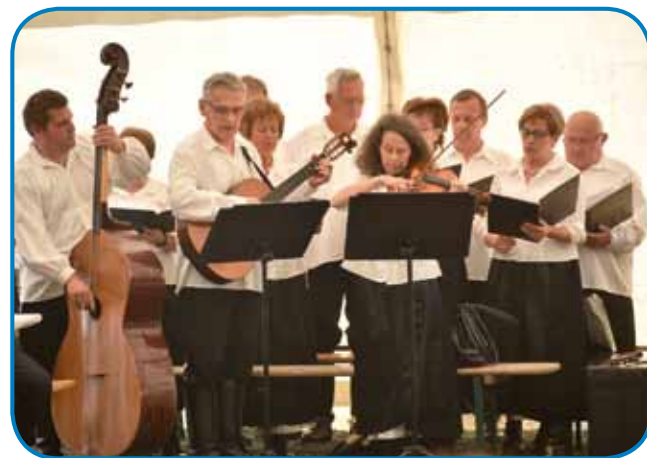
Rovački pevski zbor Zora iz Kószega spejva pri bogoslüžjaj tó, v svojom varaši majo na mejsec dvej meši v maternoj rejči