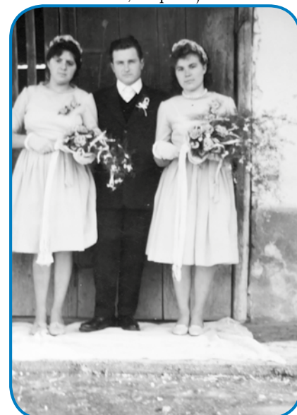
Marika kak svadbica (na lejvi strani)

moram gnauk titi, ovak sem nej zdrava. Depa nédem pejški, pelajo me, zato ka vö na tisti brejg bi že venak nej prišla. Tam je zdaj že tö vse ovak, zato ka vse je nutzaraškeno, na vsej njivaj, ka smo je delali, že lejs raste.«