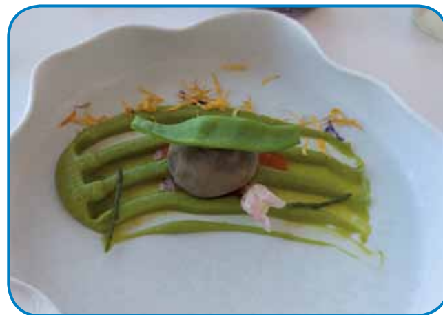
Tisto rjavo na sredi talejra je jedilna glina, v njoj pa so se skrivali mali falati ribe