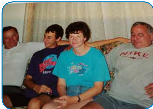
Marika s svojim sinom pa možaum na gledanji pri brati Pištani v Meriki 1999. leta

Od nijja z možaum vejm, ka tü dosta odita nazaj, dosta se zdržavata na Seniki. Zakoj je