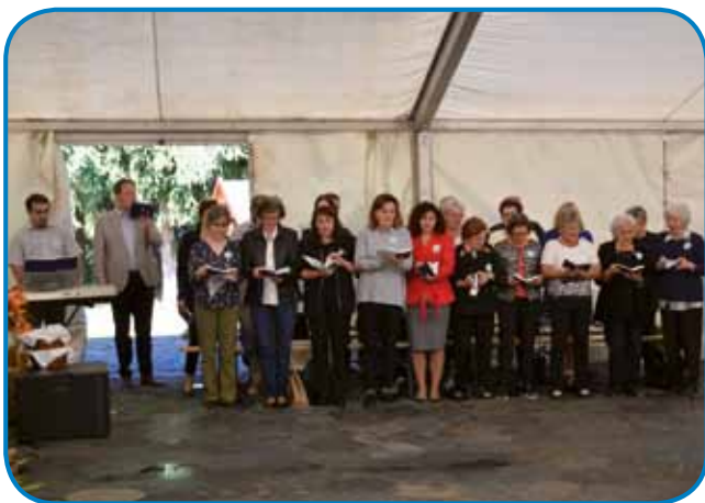
Pri svetoj meši so vküper spejvali gorenjesenčarski in števanovski cerkveni pesmarge, pomagali so jim člani MePZ Avgust Pavel

lopinja. Cejli program sta vküper organizérali Državna slovenska samouprava in Škofija Sombotel, z Gorenjoga Sinika pa lokalna samouprava, narodnostna samouprava in civilne organizacije. Tisti, šteri so se tisto sunčno so-