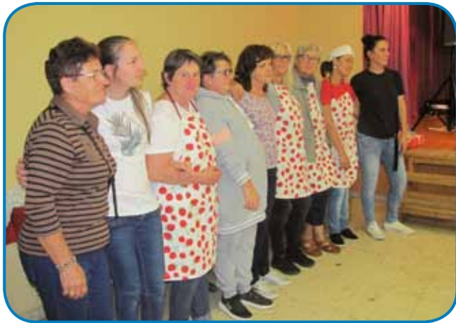
Domačinke so z veseljem pričakovale goste

prizadete, ki živijo v domu prizadetih v Iváncu. Letos je prišlo k nam 41 stanovalcev in 12 medicinskih sester. Na žalost je lani srečanje odpadlo zaradi pandemije, toda letos je bilo na srečo uspešno organizirano.