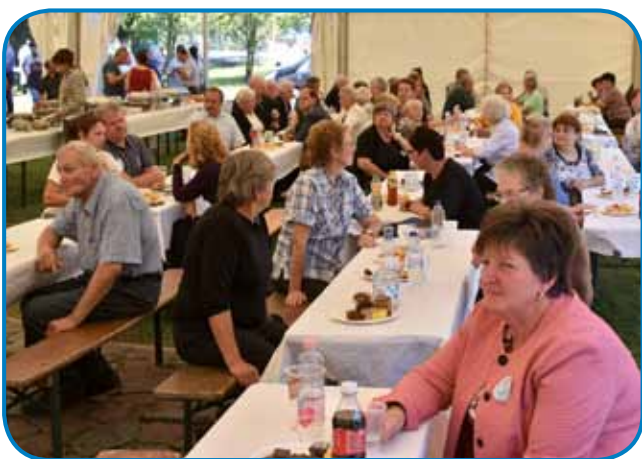
V veukom šatori pauleg gorenjesenčarske cerkve je vküpprišo vnaugo lüstva s Porabja pa od indrik tó