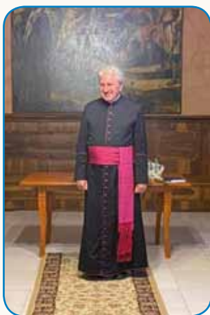
Najlepše je bilau... stran 4