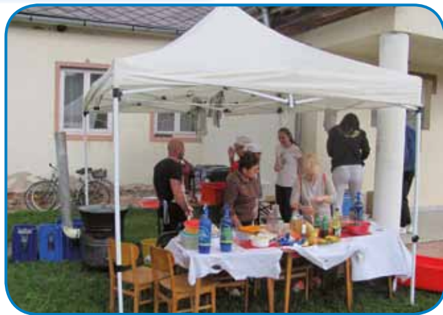
Priprave na kuhanje bograča

Ustanova v Iváncu deluje od leta 1951. Zdaj skrbi za 150 umsko prizadetih in 50 starejših oseb, ki dobivajo polno oskrbo. V ustanovi deluje pralnica, kuhinja in pomožno