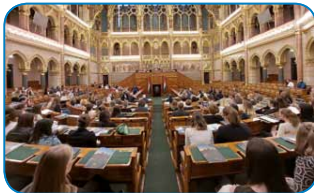
Dvorana nekdanjega zgornjega doma se je napolnila z mladimi

menta, da bi pomagal ublažiti pomanjkanje pedagoškega kadra v vrstah narodnosti. Program se je začel leta 2017, finančne vire zanj zagotavlja Urad predsednika vlade, za tehnično izvedbo skrbi Sklad Gábor Bethlen.