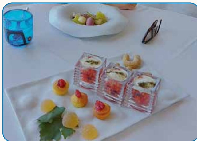
Kulinarični arhitekt Tomaž Kavčič stran 6