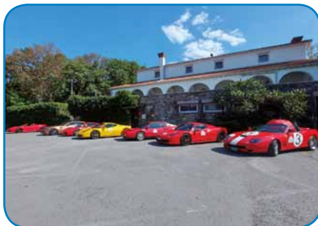
Parkejrani ferariji pred Dvorcom Zemono