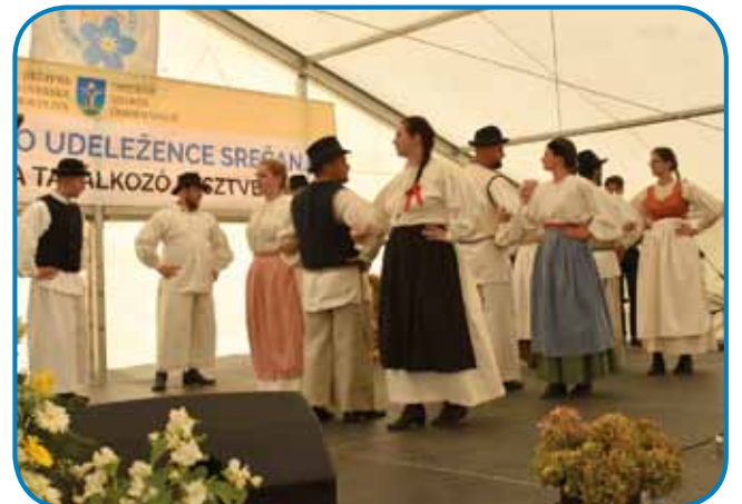
Folklorna skupina ZSM Gorenji Senik zna plesati šest odrski koreografij – člani so mladi, ljudske pleso se se včüli že v šaulskoj folklori

so Porabski Slovinci najmenjša narodnost na Vogrskom, donk lepau gordržijo svojo kulturo in šege. »Za té trüid si zaslüžüte cejlo našo pomauč,« je tapravla diplomatka in cujdala, ka sta se preminauči keden zgaudili dvej