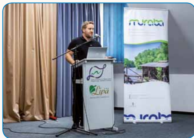
Pogodba o sodelovanju med mladimi obmejnih regij stran 5