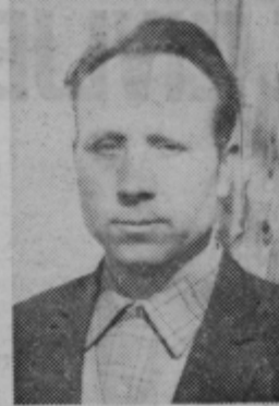
Vprašuje: Dominika Poš