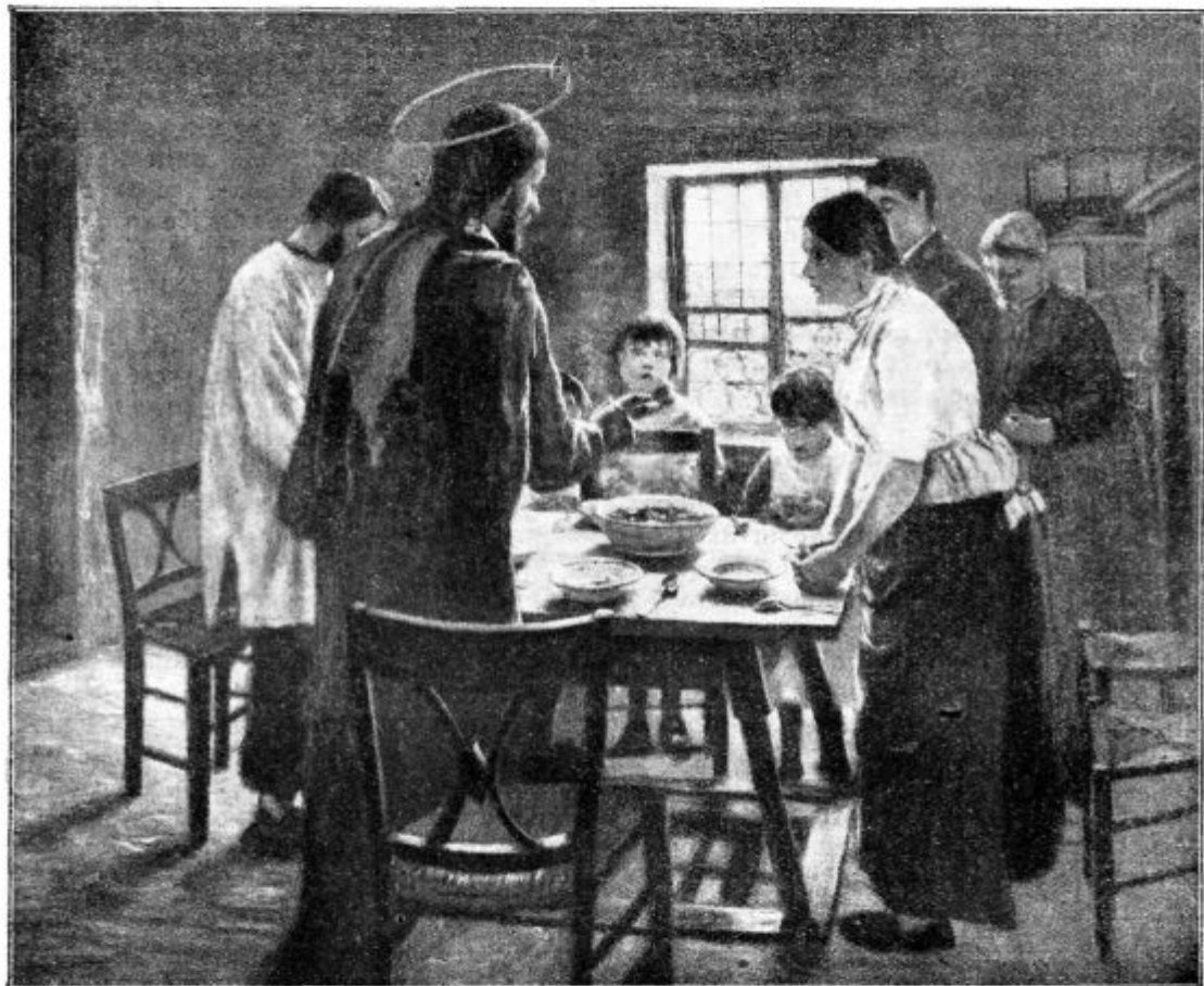
Nebeški gost v dobri krščanski družini.

Glavno pa je, da niste samo v Ljubljano prišli, ampak da se bo zdaj doma pokazal sad tega shoda. In o tem še prihodnjič.