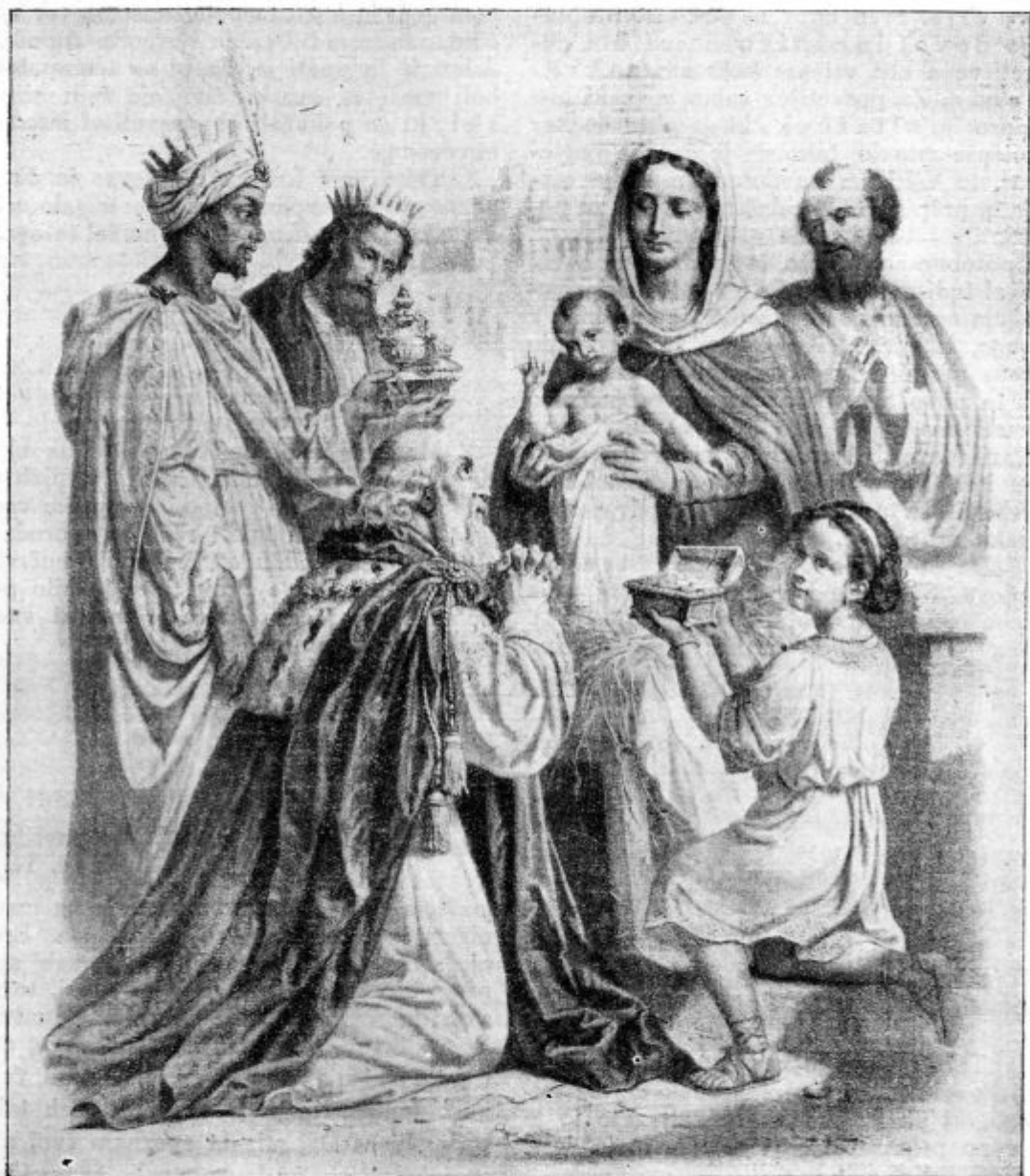
In so predenj padli in ga molili.

Molimo! Če pomislim, o moj božji Zveličar, do kake globočine ponižnosti si se ti spustil, me je sram, da se jaz tako bojim poniževanja. S tvojo pomočjo pa se hočem skupaj vzeti in nobene prilike ne opustiti, da bi se ne poniževal.