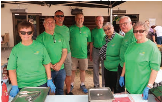
Delavci v božičnih uniformah.