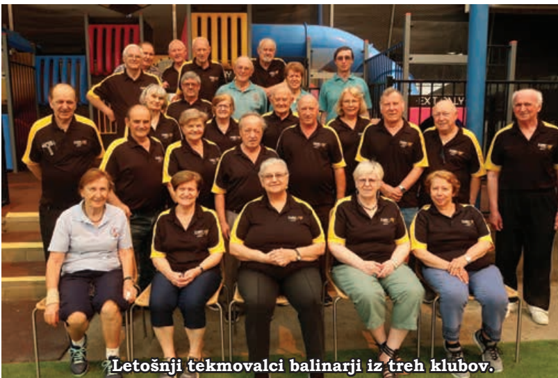
Letošnji tekmovalci balinarji iz treh klubov.

Vsako leto imamo na praznik dan Avstralije tekmovanje za pokal Avstralije, po končanem tekmovanju pa letni občni zbor balinarske sekcije in volitve odbora balinarske sekcije. Leto 2020 pa se je začelo slabo. Zaradi nepopisne vročine je prišlo precej manj članov-balinarjev in kar hitro smo zapustili balinišča in se umaknili v lepo hlajeno dvorano kluba. Ob enih popoldne, ko bi se moralo začeti tekmovanje, je termometer na baliniščitih kazal 44 stopinj Celzija in sporazumno smo sklenili, da balinanja na ta dan ne bo. Večina balinarjev se je zbrala v dvorani, kjer so igrali karte, ostali pa smo se pogovarjali in pričakali skupno zgodnjo sobotno večerjo. Zaradi manjšega števila navzočih članov smo tudi občni zbor odložili na drugi teden - če ne bo prevelike vročine.