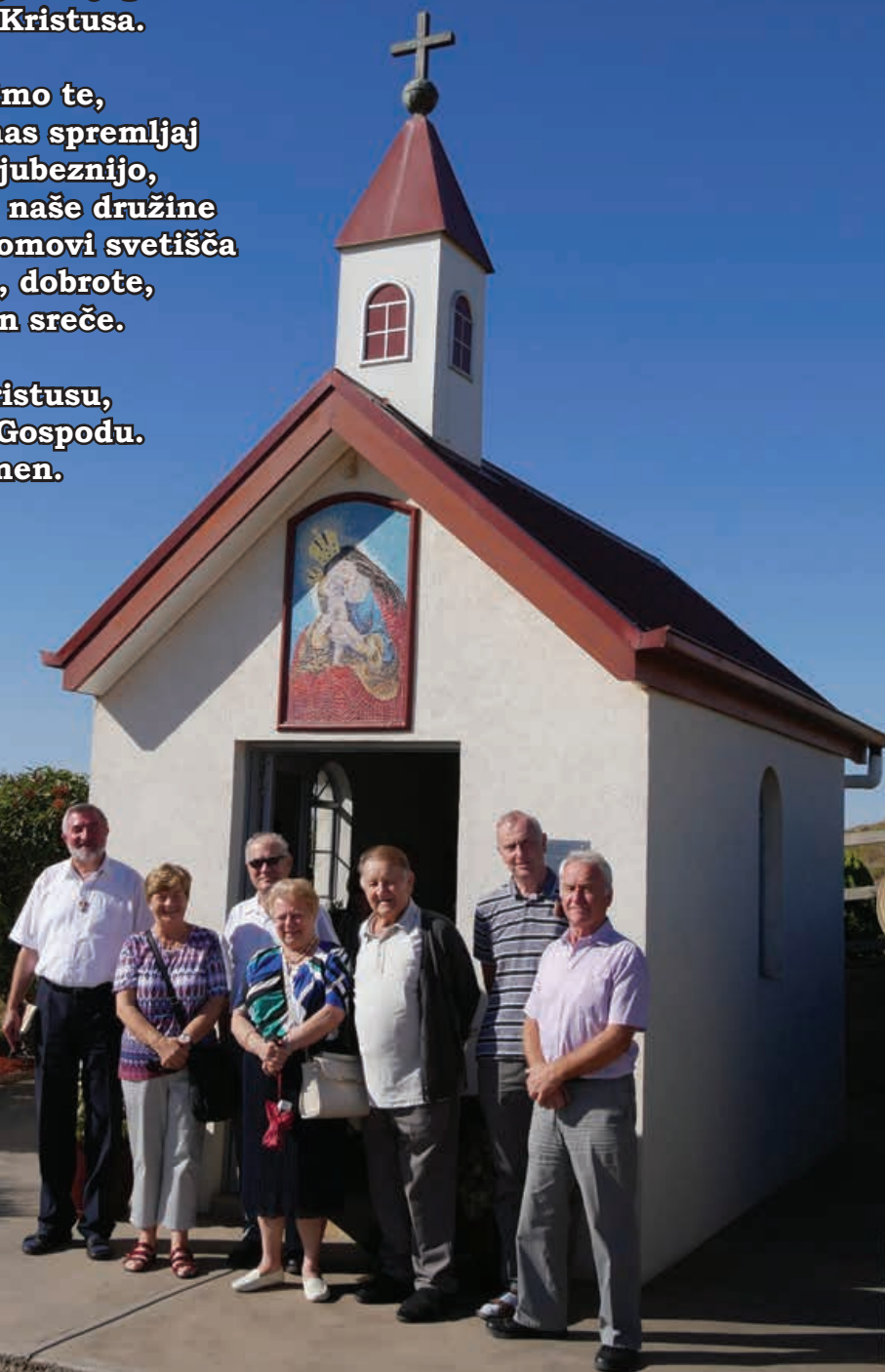
Slovenska kapelica Svete družine v Ta Pinu, Bacchus Marsh, 10. marec 2018