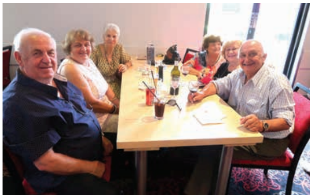
Družina Zrim s prijatelji.

Klub Triglav vsako leto priredi dobrodelno akcijo za pomoč pri raziskovanju rakastih obolenj. Ta prireditev nosi ime Movember, ker mnogi člani in uslužbenci na ta dan žrtvujejo svoje lase, brke ali brado, kar njihovi prijatelji podprejo z denarnimi prispevki. V ta dobrodelni namen pa prispeva tudi uprava kluba vse dohodke od BBQ kosila, prodaje srečk dobrodelne loterije ter peciva, pa tudi prostovoljne prispevke vseh navzočih.