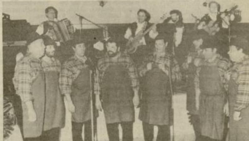
Če ne bi bilo okteta Studenček in tria Vikija Asiča bi se počutili kot če bi jedli dobro domačo juho brez soli.