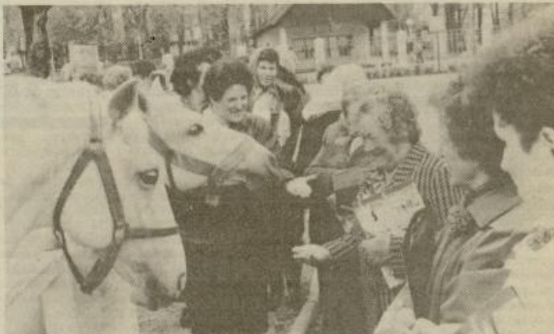
Posebne pozornosti so bili deležni lepoteči lipiške kobilarne.