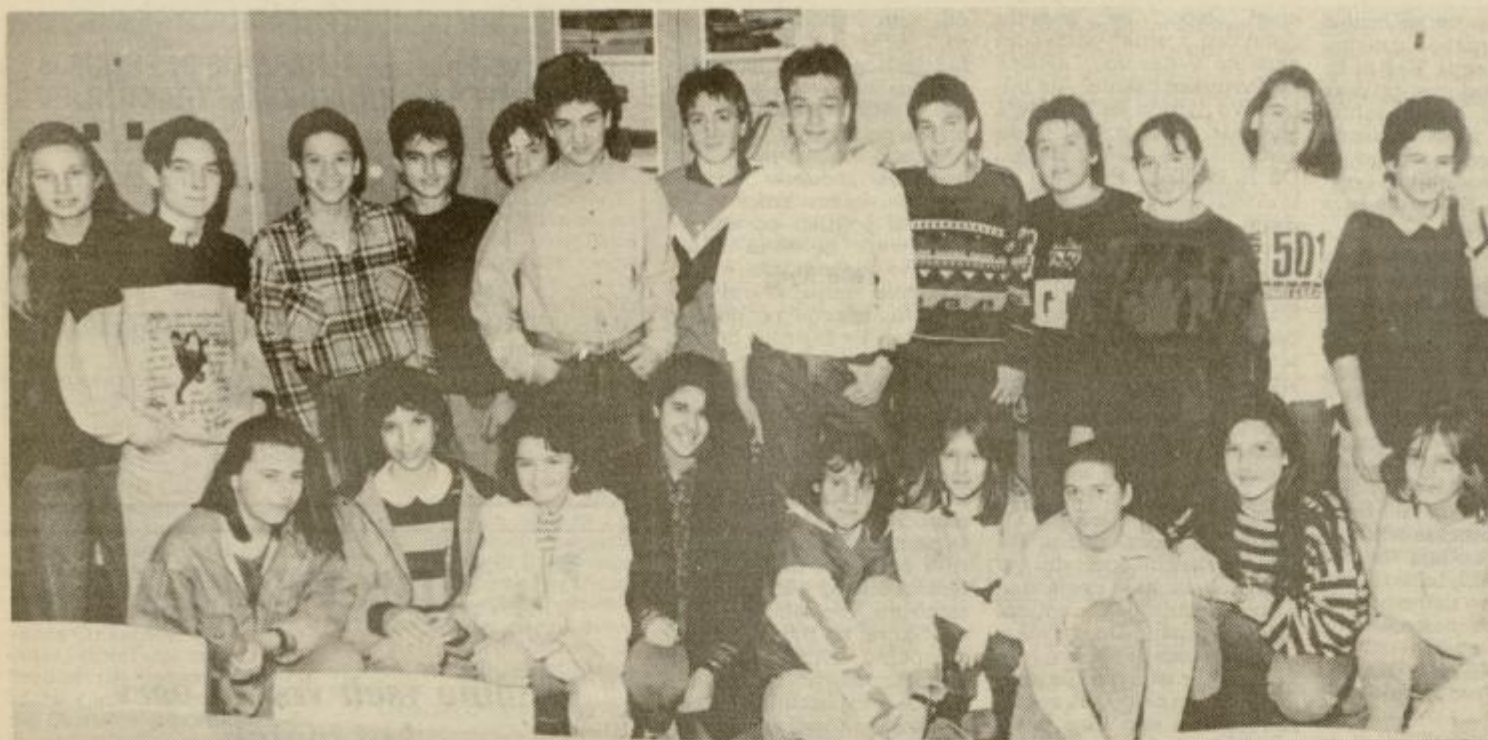
Takole so se pred objektiv našega fotoreporterja postavili učenci 8. b razreda celjske I. osnovne šole.