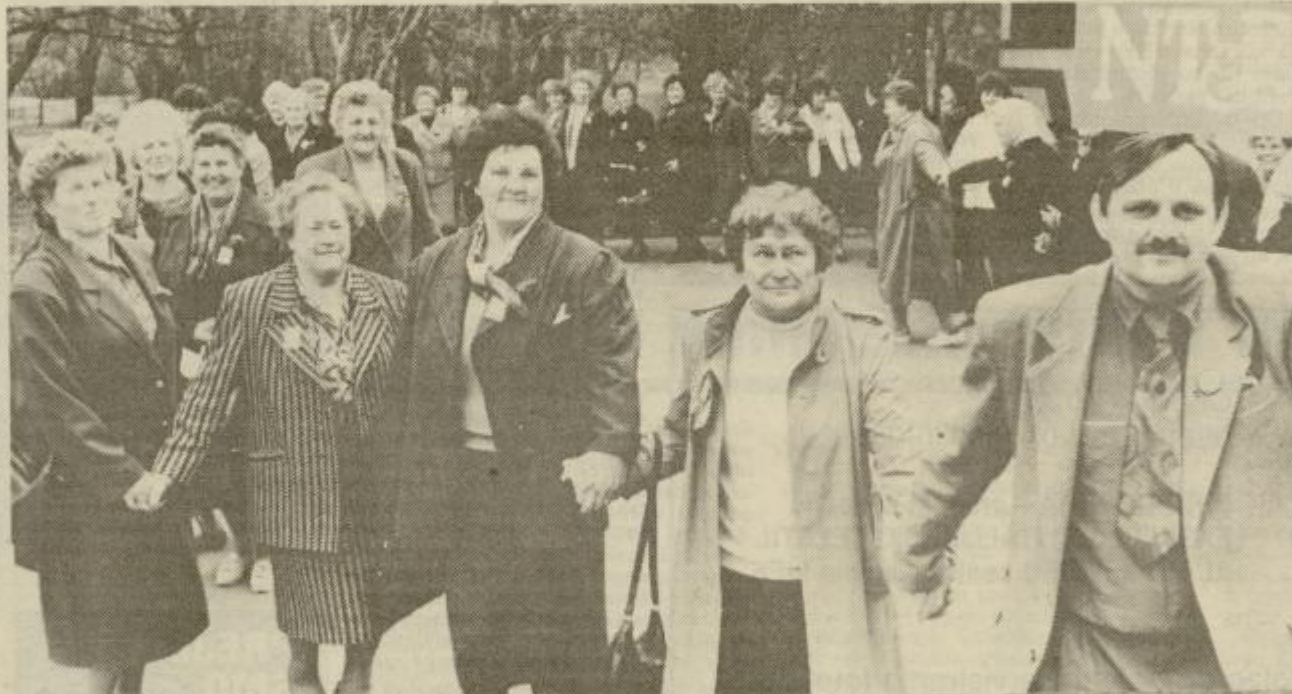
Ne samo v Lipici, ampak tudi v Luciji, takšni prizori niso bili nobena redkost.