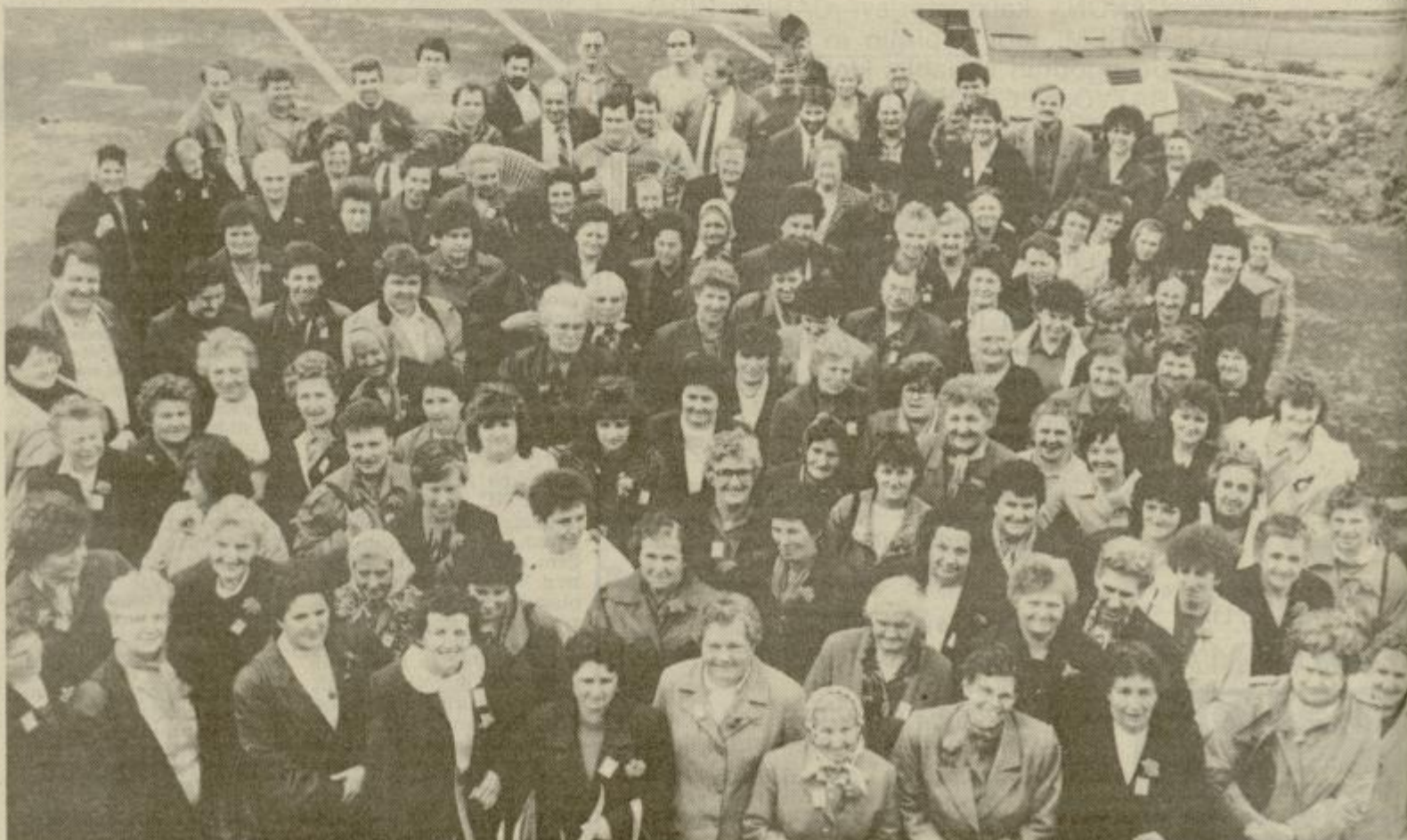
Skupinski posnetek je tokrat nastal na ploščadi pod gostiščem Tomi v Portorožu.