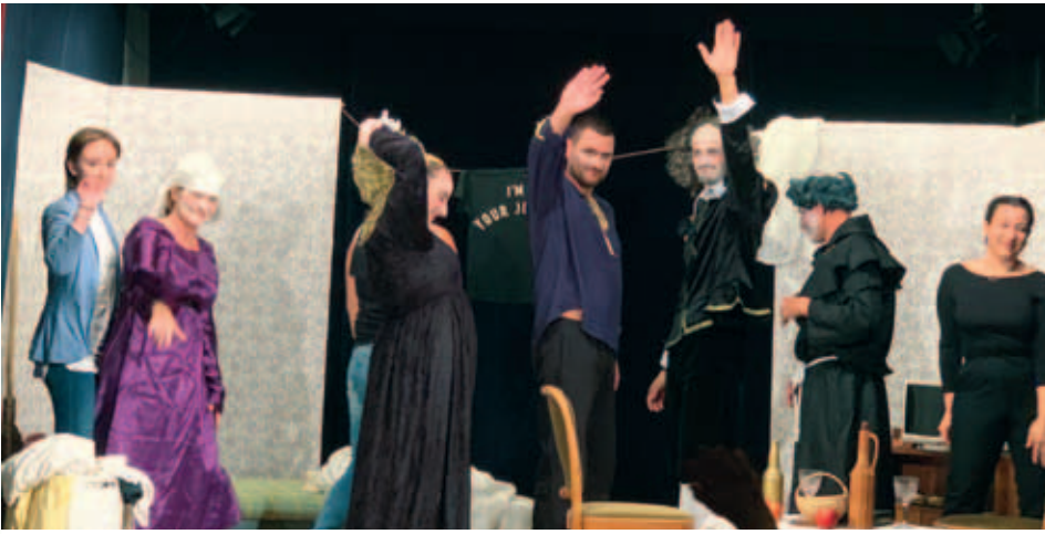
Prizor iz predstave