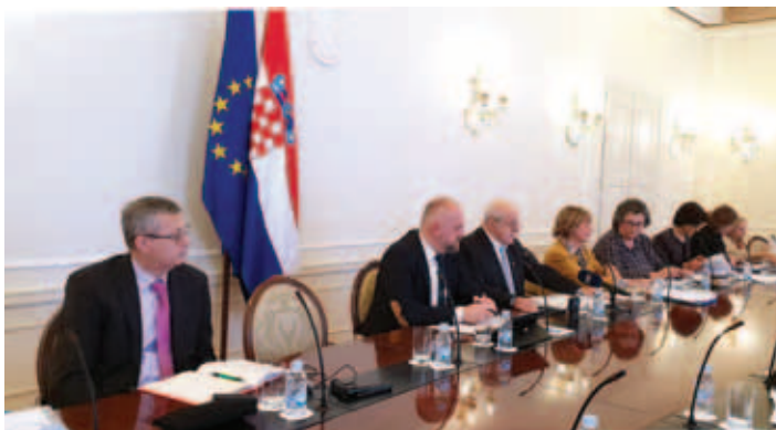
S seje, foto: www.savjet.nacionalne-manjine.info

Imenovani so tudi člani komisije, pristojne za razporeditev sredstev posameznim manjšinskim društvom in ustanovam, ki jo sestavljajo trije zunanji predstavniki in dva za to osposobljena člana Sveta za narodne manjšine RH. Razporejanje sredstev so pred tremi leti prilagodili načinu