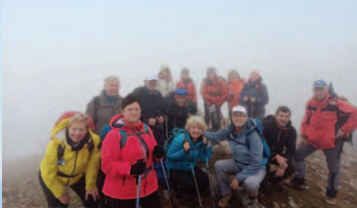
Na Babinem Grobu, foto: Đilio Arbula

Zdenka Kallan Verbanac, prevod: Darko Mohar