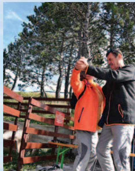
Na Slavniku se je tudi zaplesalo.