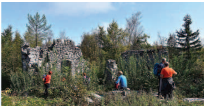
Izleti tudi srečanja s preteklostjo, foto: Darko Mohar

28. september, Skupaj s PD Opatija v Rakov Škocjan