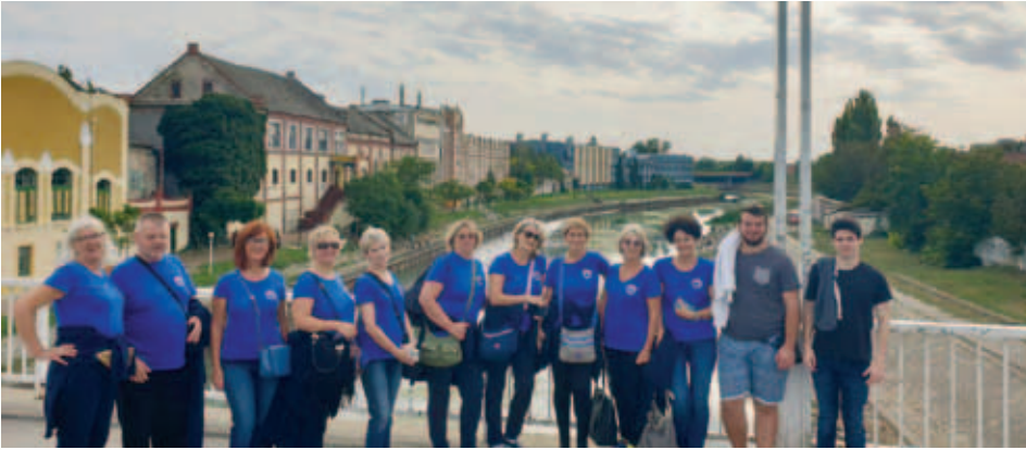
Zrenjanin, na mostu na reki Begej

Z veseljem smo se odzvali vabilu slovenskega društva (SD) Triglav iz Subotice, da na letošnjem pevskem srečanju s svojim nastopom predstavimo tudi KPD Bazovica.