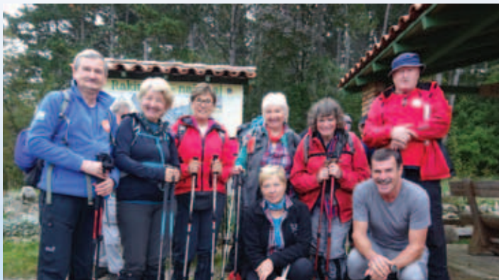
Dan istrskih planincev 2019.

dnevih istrskih planincev. Po končani slovesnosti z več govorniki iz Hrvaške in Slovenije se je dan istrskih planincev končal z odličnim fižolom za kosilo in druženjem do poznih popoldanskih ur. Po poročilu Milivoja Filipovića zapisal Darko Mohar