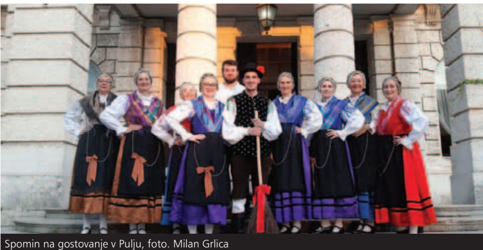
Spomin na gostovanje v Pulju