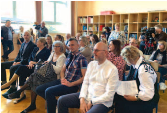
Udeleženci seminarja tudi na slovesnosti v OŠ Pečine, foto: Marjana Mirković

Čestitke ob obletnici, zelo pomembni za slovensko skupnost, saj je ta pouk k uvedbi opogumil rojake in vodstva drugih šol, so izrekli tudi gostje, predstavnika MIZŠ-ja in Urada Vlade RS za Slovence