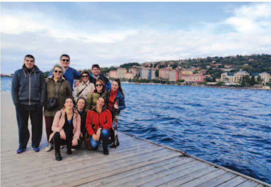
Mladi na slovenski obali