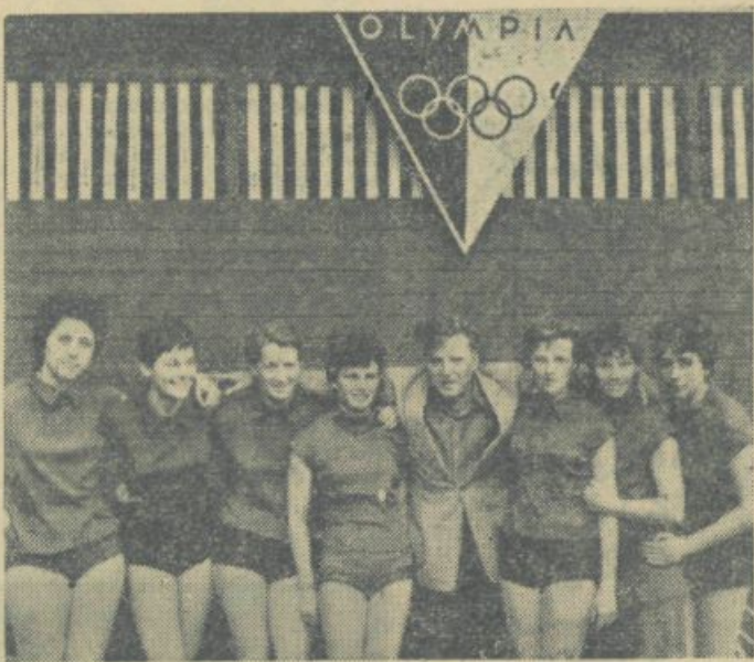
Odbojkarice »OLYMPIE« s svojim trenerjem