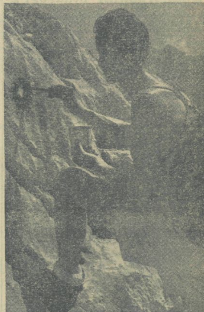
Kmalu bo prišel čas, ko bomo spet šli v hribe. Planinsko društvo Univerze se pridno pripravlja na poletno sezono