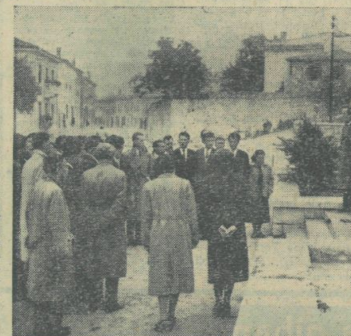
Primorski študentje so v Solkanu položili vence na grob padlih borcev

di) in v Kanalu, kjer so navzoči stali celo izven dvorane zaradi pomanjkanja prostora in je zbor dvakrat nastopil (nad 500 ljudi). Skupina, ki je izvajala Bogom (Nadaljevanje na 2. strani)