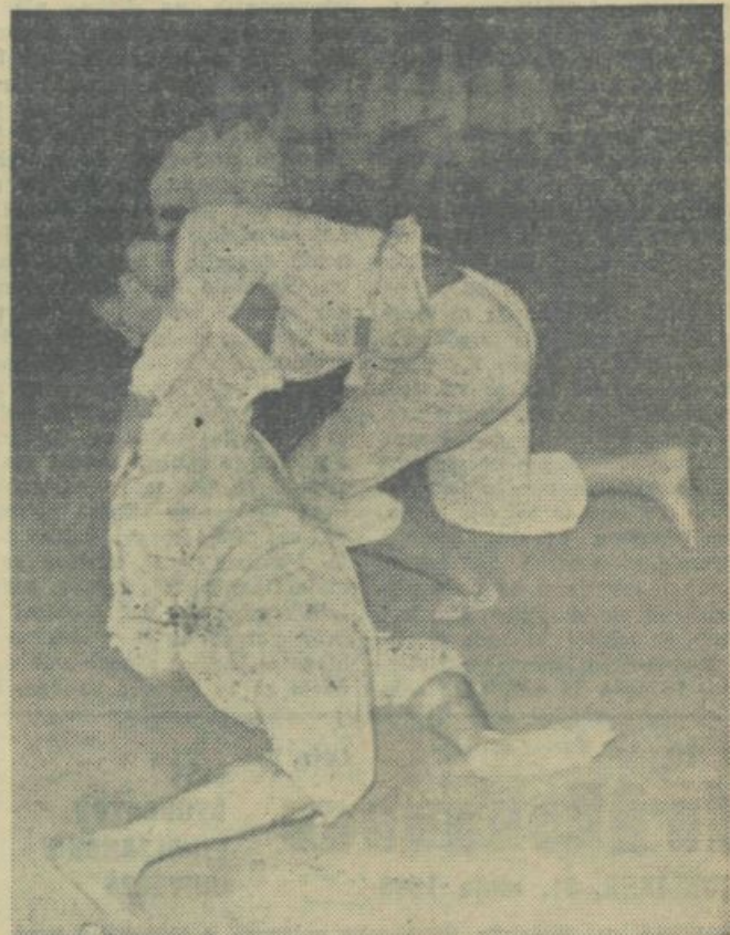
Bido je uspešno napadel. Prejšnji teden je bil dvojboj med Olympio in Ljubljano.

Trenutno se razpravlja o tem, ali je povojni visokošolski sistem potreben reforme. Posebno se diskutira o prevelikem številu univerz in koležov. Ob zaključku vojne je bilo na Japonskem 18 državnih univerz, 3 javne in 29 privatnih. Sedaj pa obstaja 72 državnih, 34 javnih in 121 privatnih univerz. Ugotovili so, da se je akademski nivo študentov s povečanjem števila univerz poslabšal. Ravno tako negativno pa vpliva na akademsko izbrabo tudi povečanje števila študentov. Zveza japonskih delavskih organizacij je pričela z akcijo za zaposlitev 138.000 študentov, ki bodo letos končali študij.