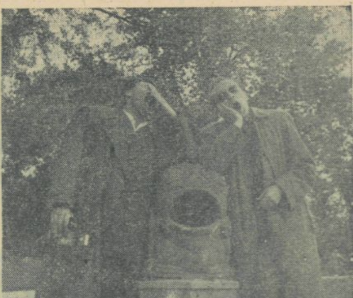
V parku se pa res ne da študirati

Prošnje za privatno prakso v inozemstvu so gotovo najboljše dokaz, kako poceni prodajajo nekateri študentje svoj narodnostni ponos in ugled, ko — gre za njihove interese. Dovolj često v teh sestavih beremo najrazličnejše izmišljotine in prikazovanja razmer, ki zdaleka ne odgovarjajo naši stvarnosti. Tako so neredki prikazi, da je naša industrija pod črto, ki beži na termometru nič stopinj. Pir nas se ne more nič videti in ni pogojev, da bi študent na praktiki v domačih podjetjih izpopolnil svoje znanje. Na žalost še vedno drži, da naši ljudje vse kar je tuje, bolj čislajo, domačih stvari pa ne znajo ceniti. Vsaj študentje bi lahko razumeli, da tako pljujejo v svojo lastno škodo.