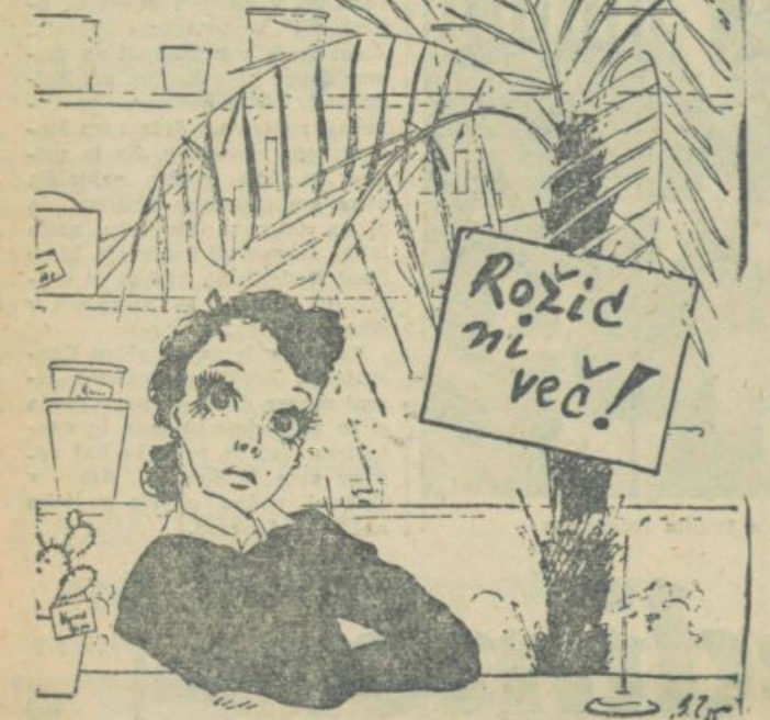
... samo še marjetkine oči!

Na slaviški so prišli do svojstvene in originalne zamisli. Sistem študija je treba prilagoditi novim pogojem in dati študiju novo vsebino. Zastarelost so slavnostno odvrtno, zato so v iskanju novih oblik dela pravi mojstri. Za zboljšanje študija bodo naredili vsakemu, ki bo vložil prošnjo, ključ od seminarja, kjer bo lahko in-