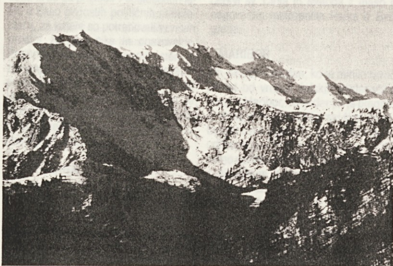
ČRNA PRST je najbolj znan vrh v grebenu Spodnjih bohinjskih gorá, ki oklepajo Bohinj z juga. Vrh ima ime po temnih skrilavcih, ki gledajo na površje.

prijemi na tem področju. To velja predvsem za razvojne oddelke pri rednih predšolskih vzgojno-izobraževalnih ustanovah, v katerih vsako leto na najbolj human način približno 550 predšolskih otrok pripravljajo na vključitev v redno ali posebno šolstvo. Ta slovenska posebnost je prvi korak k cilju, da bi čim več tako ali drugače prizadetih otrok vključili v redno vzgojno-izobraževalni proces ter jim omogočili zaposlitev. V Sloveniji v posebnih zavodih, izobraževalnih in drugih ustanovah deluje približno 1600 defektologov. V posebne vzgojnoizobraževalne ustanove, ki jih je na Slovenskem 75, je trenutno vključenih približno 5000 telesno, duševno ali vedenjsko motenih oziroma dolgotrajno bolnih otrok. Veliko prizadetih in motenih otrok je vključenih v posebne oddelke pri rednih šolah, medtem ko je 550 kategoriziranih otrok vključenih v redne razrede. V vsaki generaciji se v Sloveniji rodi približno tisoč otrok, ki so v vzgojno-izobraževalnem procesu potrebni posebne obravnave.