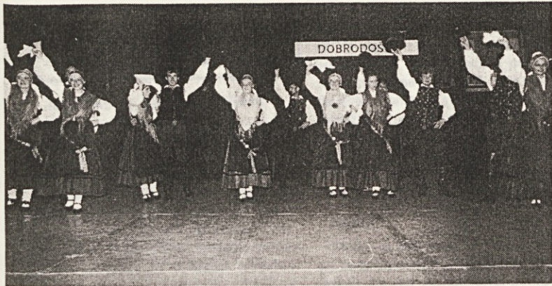
Folklorna plesna skupina France Prešeren iz Celja po nastopu na Slovenskem dnevu veselo pozdravlja.

Zbor je želel čim lepše predstaviti slovensko pevsko kulturo pred slovenskim in francoskim občinstvom. Deležen je bil bratskega gostoljubja od strani Društva Slovencev v Parizu. Iskrena zahvala vsem! V slogi je moč! Živijo!