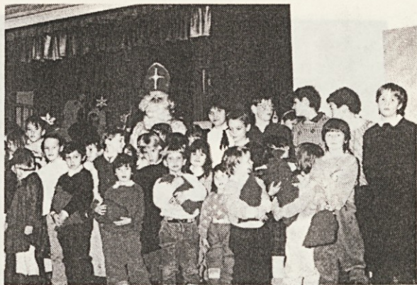
Na lanskem miklavževanju v Münchnu je bilo poleg sv. Miklavža, Petra, Antona, angelov in hudobcev spet našega drobiža, kakor bi hruško potresel.

sta faranka in članica našega pevskega zbora. Pokopali smo jo na Severnem pokopališču tukajšnjega mesta.