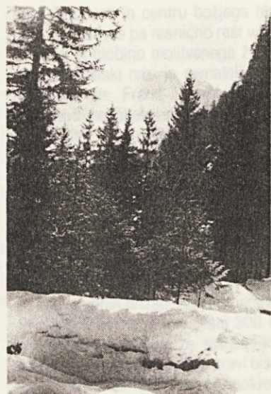
OVČJA VAS leži med Žabnicami in Ukvamami in je izhodišče za na Sv. Višarje.