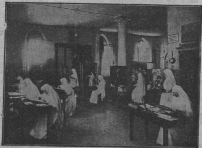
Misijonsko delo. Bele sestre slikajo pobožne podobice, ka bi se potom teh pridobile duše nevernikov za bože kraljestvo.