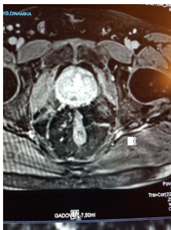
Slika 2: T2 obtežena slika s pokontrastnim obarvanjem

T2 obtežene slike in difuzijske slike so osnova za oceno lezij v prehodni in v periferni coni. Lezije, ki imajo slikovne značilnosti nerakavih sprememb, označimo kot PI-RADS 1 in PI-RADS 2. Pri lezijah, ki jih definiramo kot PI-RADS 3, PI-RADS 4 in PI-RADS 5 je verjetnost CaP velika. Končno diagnozo CaP postavimo z biopsijo prostate. Lezije PI-RADS 3, predstavljajo manj zanesljivo območje v oceni, o nadaljnjih diagnostičnih postopkih se odločamo, ko ocenimo slikovne, klinične ter laboratorijske parametre (Scalpi, Rondoni, Aisa in drugi, 2017). Lezije periferne cone, ki jih predkontrastno ocenimo kot PI-RADS 3, v primeru zgodnjega fokalnega pokontrastnega obarvanja definiramo kot PI-RADS 4 lezije. Taghipour s sodelavci so v študiji potrdili, da imajo lezije periferne cone, ki se pokontrastno obarvajo, višjo stopnjo malignosti v primerjavi z lezijami, ki se ne obarvajo (Taghipour, Ziaei, Alessandrino in drugi, 2019; Zeng, Cheng, Zhang in drugi, 2021). Pokontrastno obarvana prostata je prikazana na Sliki 2.