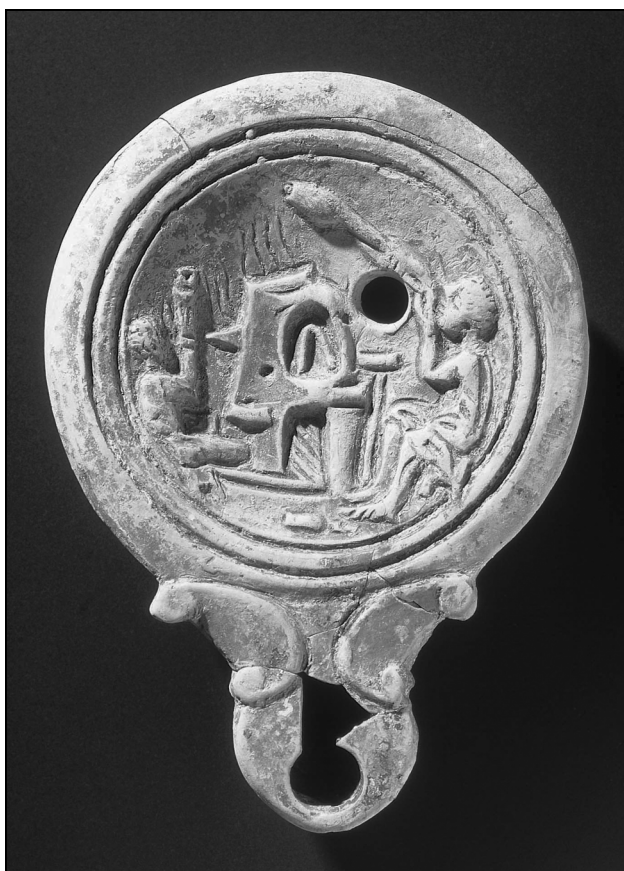
Sl. 2: Fotografija oljenke iz groba v Spodnjih Škofijah.

Fig. 2: Photograph of an oil lamp found in a grave in Spodnje Škofije.