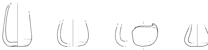
Sl. 4: Delno ohranjeni balsamariji iz groba 152 (M = 1:2). Fig. 4: A partly preserved balsamaria from grave no. 152 (scale 1:2).

Ostalih pridatkov v grobu skoraj ni bilo, omenimo naj odlomek železnega okova in bronasta novca. Eden od njiju je močno izrabljen bronast novc cesarja Klavdija (41–54), drugi pa je bil preslabo ohranjen za točno določitev. 5 Kostni ostanki iz groba so bili žal preskromni za analizo. Glede na sestavo in skromen obseg grobnih pridatkov lahko grob umestimo v drugo polovico 1. stoletja ali morda celo na začetek 2. stoletja.